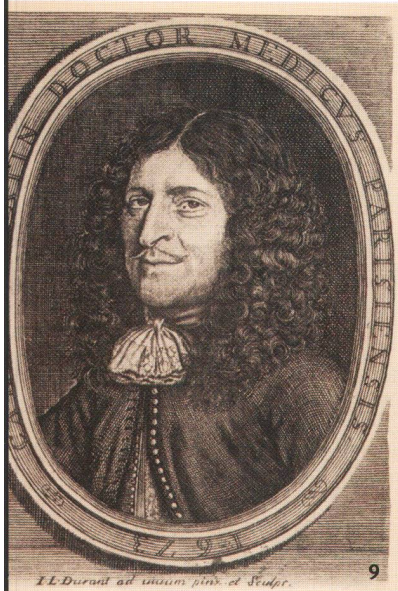
Abb. 9 Der Pariser Arzt Charles Patin besuchte auf seiner «Grand Tour» auch die Ruinen von Augst und die Antikenkabinette in Basel. Für seine Sammlung kaufte er Bauern in Augst Münzen ab.

Oggetto di continui saccheggi: all'inizio del XVIII sec. si rinvenne il tempio di Grienmatt. Su questa litografia colorata a mano del XIX sec., il monumento è situato sulla sinistra, ricoperto da alberi.