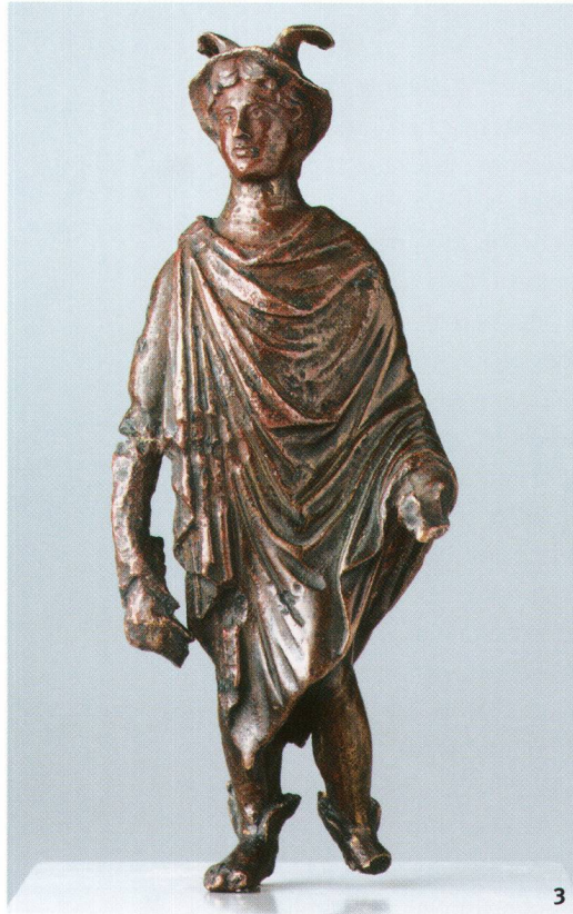
Abb. 3 Merkur von Uster ZH (A-3446). Die Statuette ist provinzieller in der Gestaltung, aber noch sehr souverän geformt. Höhe 14,5 cm.

Mercurio d'Uster (ZH) (A-3446). La statuette semble être une œuvre provinciale, même si elle a été soigneusement exécutée. Hauteur: 14,5 cm.