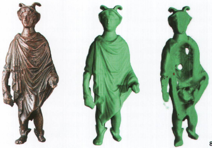
Abb. 8 Der Merkur von Uster (Abb. 3) als Foto (links), Tomographieansicht der Aussenkonturen (Mitte), und im Schnitt durch das Objekt, erzeugt mit Hilfe von numerischen Verfahren aus dem Tomographiedatensatz (rechts).

Le Mercure d'Uster (fig. 3) en photographie (à gauche); la tomographie aux neutrons montre les limites extérieures de la statuette (au centre); coupe produite de manière numérique à l'aide de données obtenues par la tomographie aux neutrons (à droite).