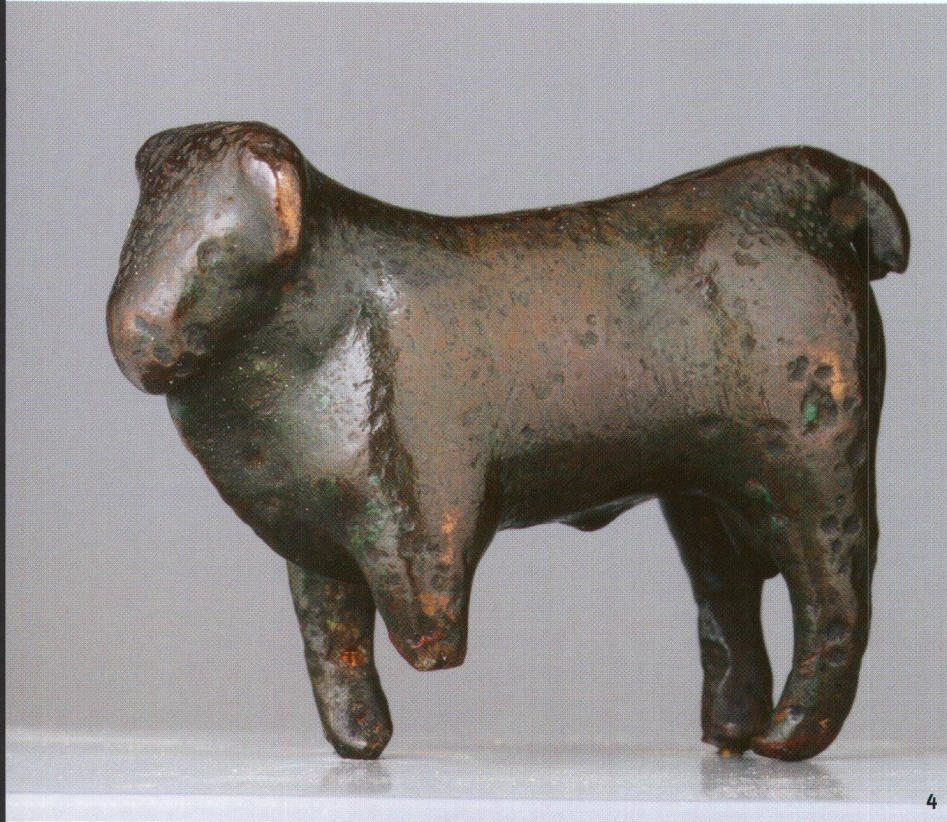
Abb. 4 Stierstatuette aus Winterthur- Oberwinterthur ZH (A-3387). Die ein- fache Figur dürfte ein Votiv gewesen sein. Höhe 4,5 cm; Länge 6,5 cm.

Statuette de taureau provenant de Winterthour-Oberwinterthour (ZH) (A-3387). La figurine, de facture simple, a probablement fait office d'ex-voto. Hauteur: 4,5 cm; Longueur: 6,5 cm.