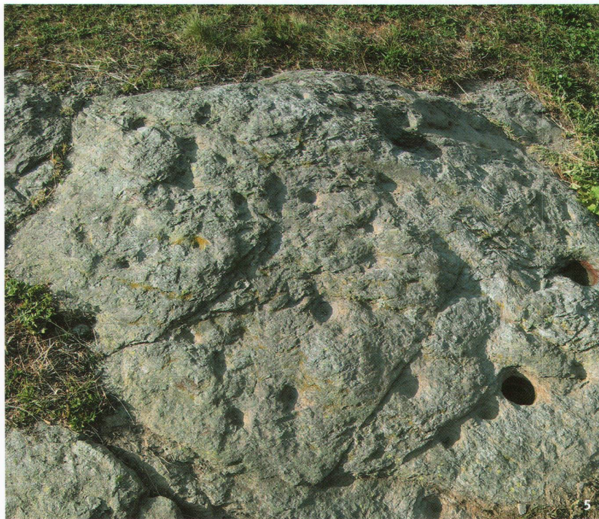
Abb. 5 Der Schalenstein von Gampisch 1 bei Punkt 1841.

La pierre à cupules de Gampisch 1, près du point 1841.