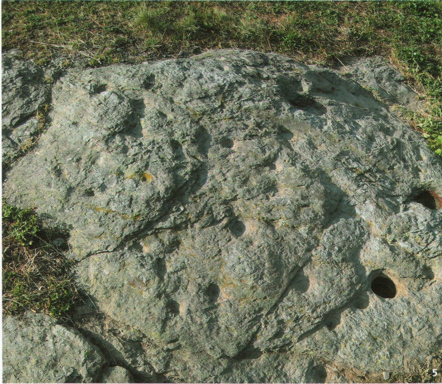
Abb. 5 Der Schalenstein von Gampisch 1 bei Punkt 1841.

La pierre à cupules de Gampisch 1, près du point 1841.