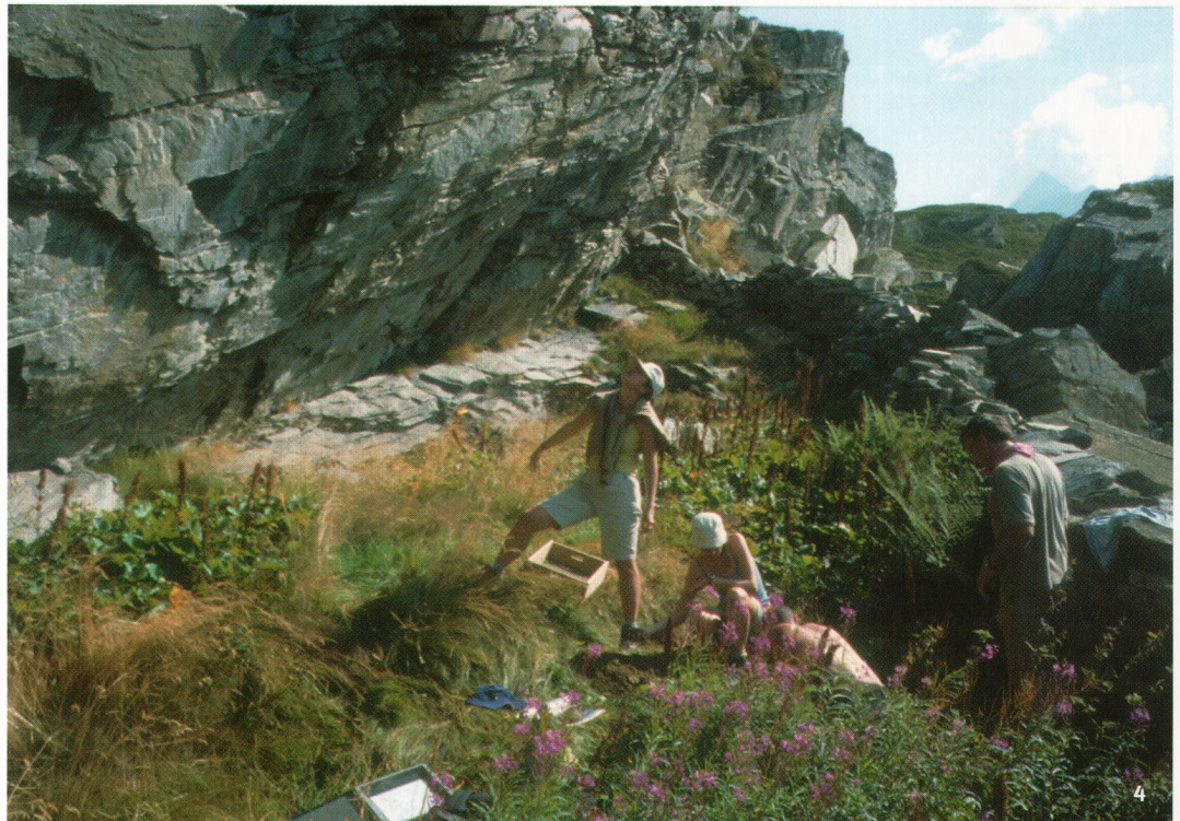
Abb. 4 Bohrsondierung im Abri Blatte. Prélèvements dans l'abri sous roche «Blatte». Carotaggi nel riparo sotto roccia Blatte.

Wenn man ständig die Nase am Boden hat, stolpert man unwillkürlich auch über den einen oder anderen Schalenstein. So gelang es, vier neue Schalensteine im Untersuchungsgebiet zu lokalisieren. Darunter eine grosse Gneisplatte mitten im