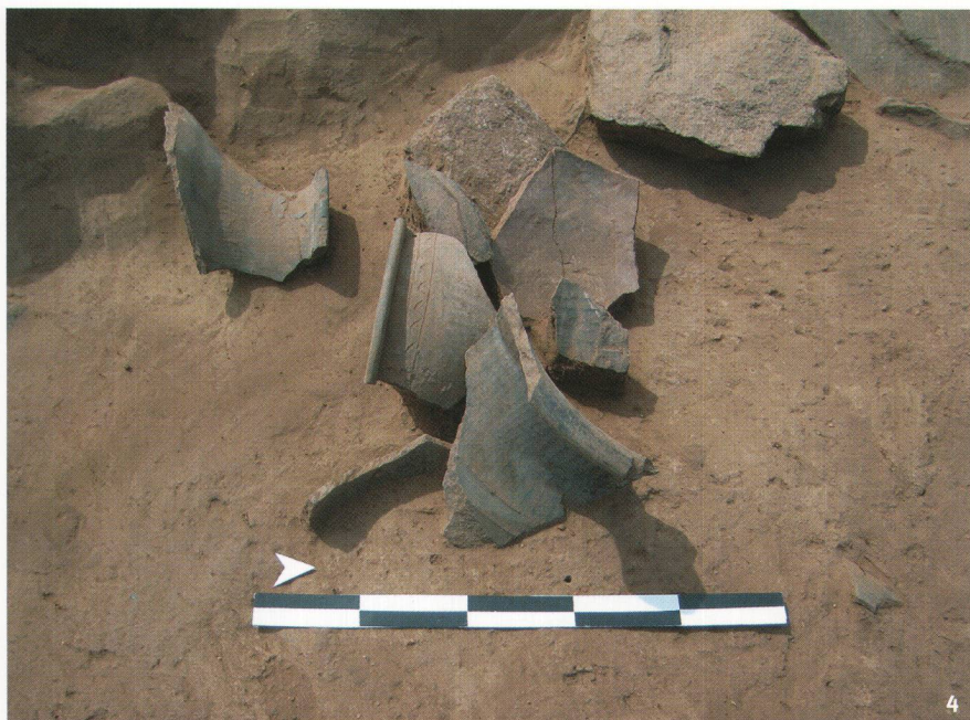
Fig. 4 Fragments de poterie découverts à l'intérieur d'une maison semi-enterrée.

Keramikfragmente aus dem Innern eines zur Hälfte in den Boden eingetieften Hauses.