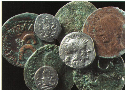
Baden-Römerstrasse 10/12 (2004). Le monete contenute nel piccolo borsellino, a restauro ultimato.