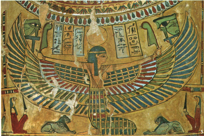
Fig. 5 Les lignes de texte au-dessus des ailes déployées de la déesse du ciel peinte sur le couvercle du sarcophage mentionnent les noms et les titres de Nes-Shou et de ses parents. Père et fils portent tous deux le titre de prêtre-sématy (responsable des vêtements) du dieu de la fertilité Min, objet d'une vénération particulière dans la région d'Akhmîm.

Die Textzeilen über den ausgebreiteten Flügeln der Himmelsgöttin auf dem Sargdeckel nennen Namen und Titel des Nes-Schu und seiner Eltern. Vater und Sohn tragen beide den Titel eines Sema-(Bekleidungs-)Priesters des Fruchtbarkeitsgottes Min, der besonders in der Gegend von Achmim verehrt wurde.