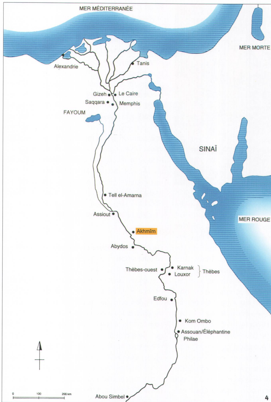
Fig. 4 Carte de l'Égypte avec les localités et les lieux de découvertes majeurs.

Karte Ägyptens mit den wichtigsten Ortschaften und Fundstätten.