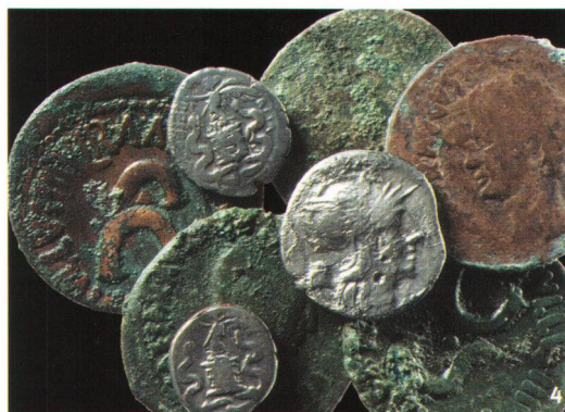
Baden-Römerstrasse 10/12 (2004). Le monete contenute nel piccolo borsellino, a restauro ultimato.