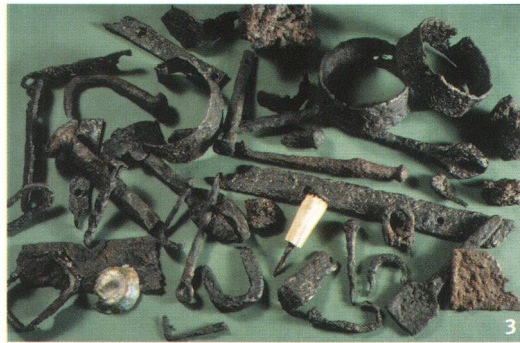
Obersiggenthal-Kirchdorf, Brühl 1997. I reperti di metallo e il pun- teruolo con impugnatura d'osso a restauro ultimato. Si tratta perlopiù d'elementi di carro e borchie di vario tipo. Un unico reperto, una falera, è di bronzo.