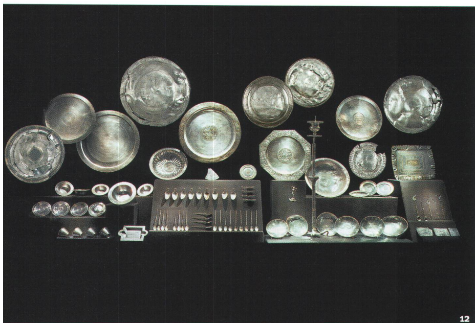
Fig. 12 L'ensemble du trésor d'argenterie de Kaiseraugst, sans les monnaies.

Insieme del tesoro d'argento di Kaiseraugst (senza monete).