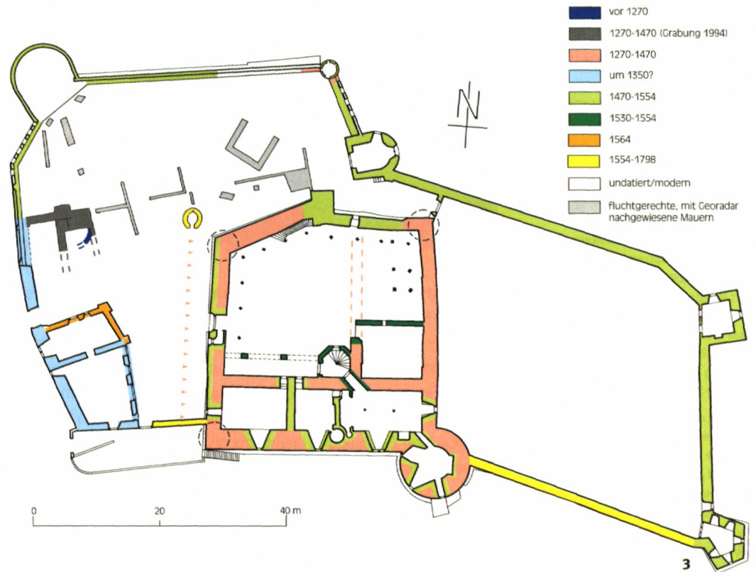
Abb. 3 Plan der Schlossanlage mit Eintragung der Bauphasen. Piantina del castello e fasi costruttive.

gänzt wurden diese archäologischen Forschungen durch eine Untersuchung mit Georadar im Bereich des Vorhofs und im Innenhof des Schlosses. Die jüngsten baulichen Interventionen im Schloss haben ebenfalls archäologische Untersuchungen ermöglicht. Weitere Entdeckungen – so anlässlich von archäologischen Ausgrabungen bei Les Adoux und viele Einzel- bzw. Zufallsfunde aus dem 19. und dem Beginn des 20. Jahrhunderts – gab es auf dem weitläufigen Gemeindegebiet, das sich über die Abhänge des Moléson erstreckt.