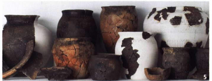
Fig. 5 Céramiques du site laténien de Marin-Epagnier/Les Bourguignonnes, à divers stades de restauration.

à Neuchâtel est dorénavant accessible au public, dans le dépôt visitable et dans l'exposition permanente. Ces vitrines, densément remplies, permettent également de différencier la contribution des sites lacustres – dont le contenu est exceptionnel – de celle des gisements terrestres où, parfois, une seule poignée de tessons matérialise une période donnée, ces fragments présentant ainsi une valeur scientifique inestimable. Le rôle joué par les travaux de conservation-restauration peut également être analysé au travers de ces objets. En effet, les interventions ont été interrompues sur certaines pièces à différentes phases du traitement