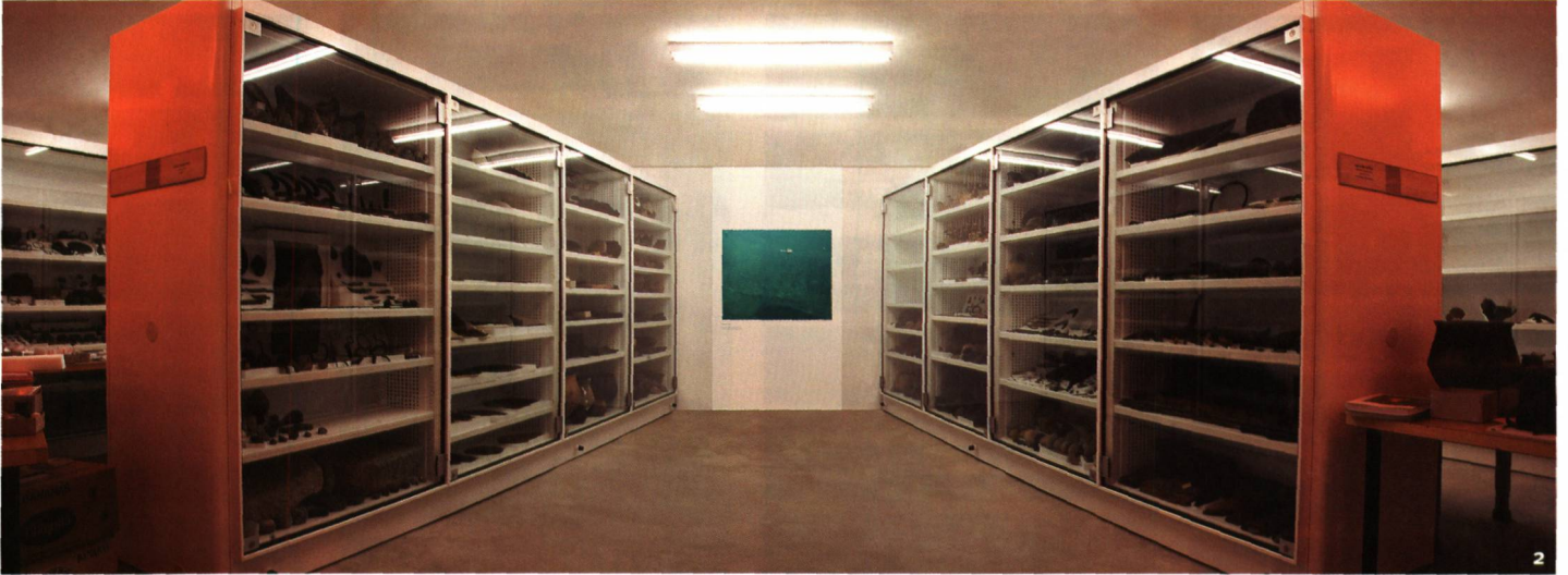
Fig. 2 Espace consacré à la présentation des sites du Bronze final.

unité en fonction du type de matériel exposé ou de mettre rapidement en œuvre des mesures conservatoires si elles s'avèrent nécessaires. Des ouvertures sont aménagées au sommet des éléments mobiles, offrant la possibilité d'installer un éclairage par fibres optiques; des alimentations électriques sont présentes dans les murs à la hauteur de chaque unité. Les éléments peuvent être repoussés les uns contre les autres au fond du dépôt, dégageant ainsi un espace qui permet d'entreposer, en cas de conflit, l'ensemble des pièces figu-