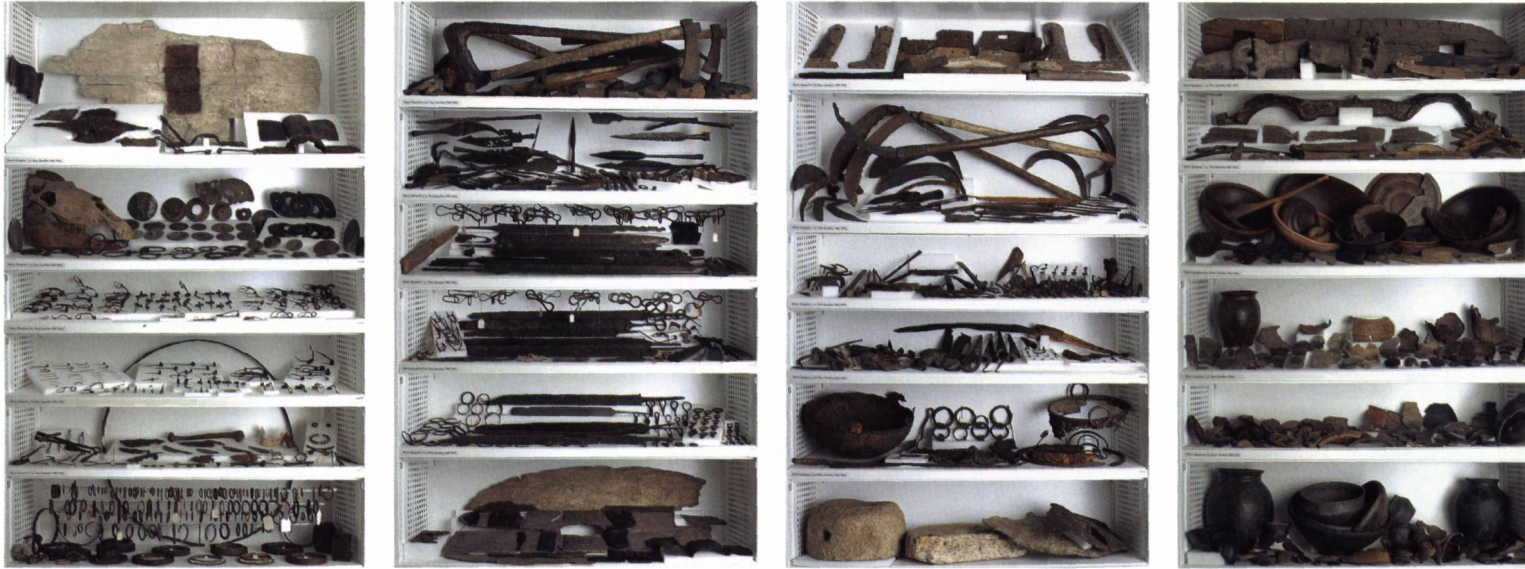
Fig. 4 La totalité d'un élément mobile a été réservée pour présenter le mobilier découvert sur le site de La Tène.

les pages de notre passé ne sont pas encore écrites. Ainsi, il y a une vingtaine d'années, quatre étagères auraient été suffisantes pour exposer les objets du Premier âge du Fer découverts dans le canton de Neuchâtel. Cette situation a radicalement changé avec les fouilles réalisées sur le tracé de l'autoroute A5 ou sur certaines parcelles utilisées pour des constructions industrielles.