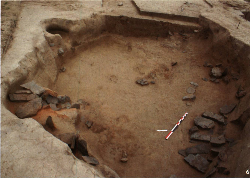
Abb. 6 Mongolei. Einrichtung des Lokus 33 in Boroo. Links erkennt man einen Ofen aus Schieferplatten und Tonscherben sowie den Ansatz des Ofenrohres. Auf der rechten Seite liegen Schieferplatten am Boden: Es handelt sich um einen Teil des umgekippten Rohres.

Mongolie. Les aménagements internes du locus 33 à Boroo. Sur la gauche de l'image, on distingue le four construit en dalles de schiste et tessons de poterie, avec le départ du conduit de chauffe. Sur la droite, les dalles de schiste à plat sont en position secondaire: il s'agit d'une partie du conduit qui a basculé sur le sol.