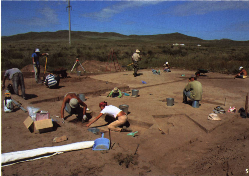
Abb. 5 Mongolei. Die Sektoren der ersten Terrasse während der Grabungsar- beiten in Boroo.

Mongolie. Les secteurs de la pre- mière terrasse au cours des fouilles du site de Boroo.