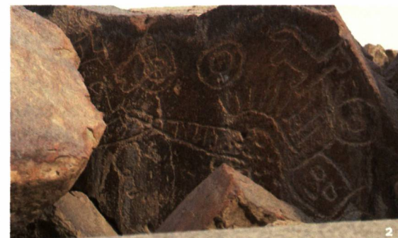
Abb. 2 Peru. Petroglyphe (Felszeichnung) in Chichictara.

Les travaux scientifiques sont entrepris en accord direct avec les instances locales. Autant que possible, des forces indigènes sont intégrées et formées si nécessaire afin de les préparer à poursuivre les recherches et à les mener à bien de manière indépendante. Les projets SLSA sont également supposés procurer du travail et un revenu aux populations locales. Dans ce contexte, il faut être attentif