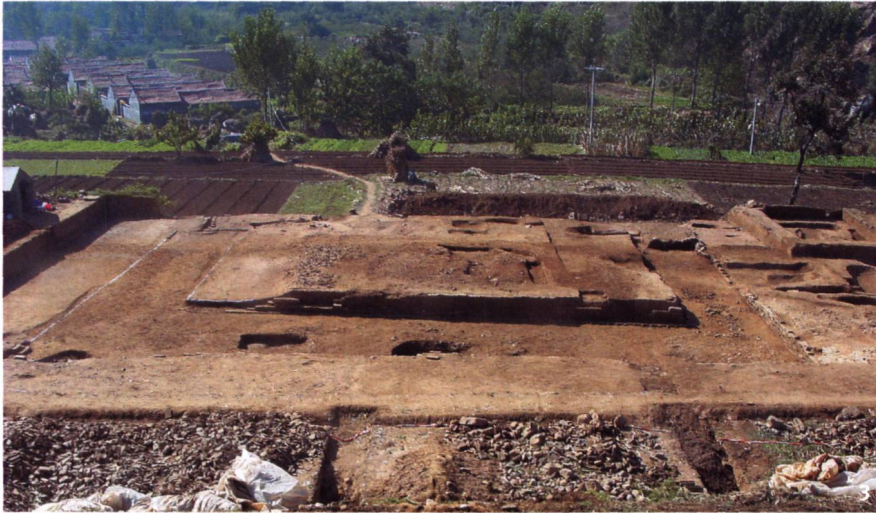
Abb. 3 China. Das Tempelareal in Bailongsi gegen Süden. In der Mitte die zentrale Plattform, umgeben von dem mit Blendmauern ausgekleideten, hufeisenförmigen Graben mit den beiden Wasserausflüssen.

Chine. Le secteur du temple de Bailongsi, vue vers le sud. Au centre s'élève la plate-forme entourée d'un fossé en forme de fer à cheval aux parois revêtues de mortier et qui comporte deux écoulements d'eau.