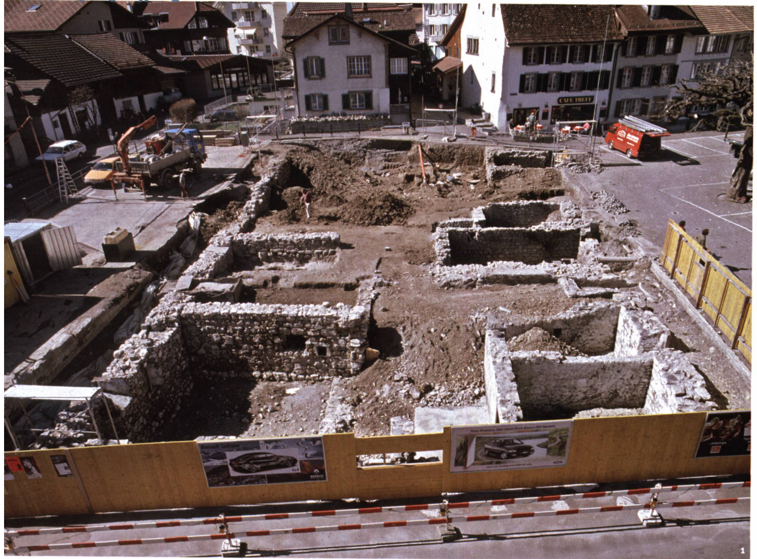
Abb. 1 Unterseen. Blick auf die archäologischen Grabungen. Sichtbar sind die Grundmauern und Keller der mittelalterlichen Gebäude im Bereich des südlichen Stadttores.

Unterseen. Vue des fouilles archéologiques. Soubassements et caves des édifices médiévaux situés à proximité des tours sud de la ville.