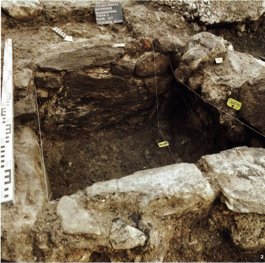
Abb. 2 In dieser mit Steinen ausgekleideten Grube kamen nebst Überresten von Talglämpchen, Geschirr und Gläsern Tausende von Tierknochen zum Vorschein.

Dans cette fosse revêtue de pierres ont été mis au jour des petites lampes à suif, de la vaisselle et des récipients en verre, ainsi que des milliers d'ossements animaux.