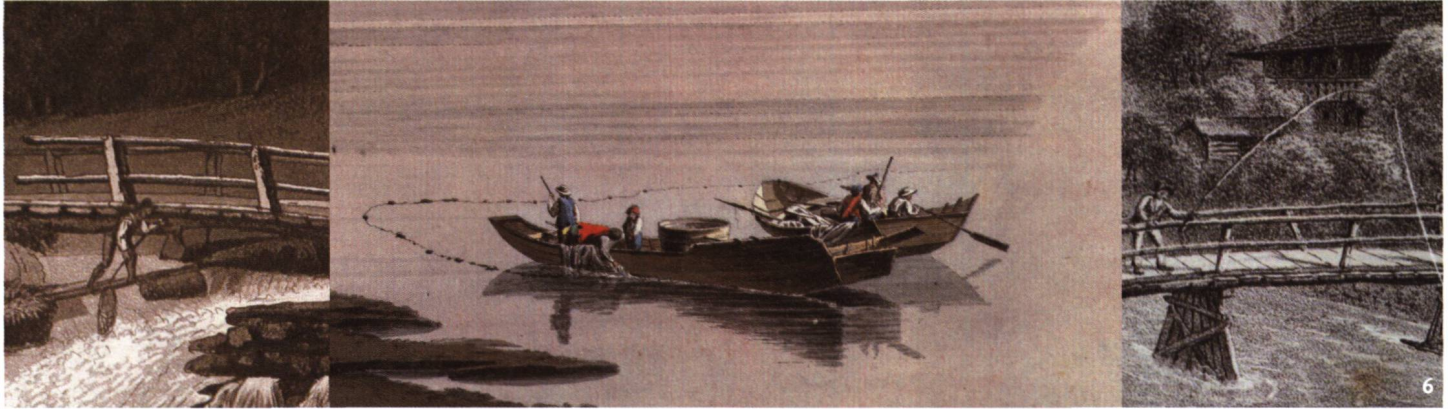
Abb. 6 Reuse, Netz und Angel. Historische Fischereiszenen an den Aareschwellen bei Unterseen und auf dem Thunersee bei Spiez.

Nasse, filet et ligne. Anciennes scènes de pêche sur les rives de l'Aar près d'Unterseen et sur le lac de Thoune, près de Spiez.