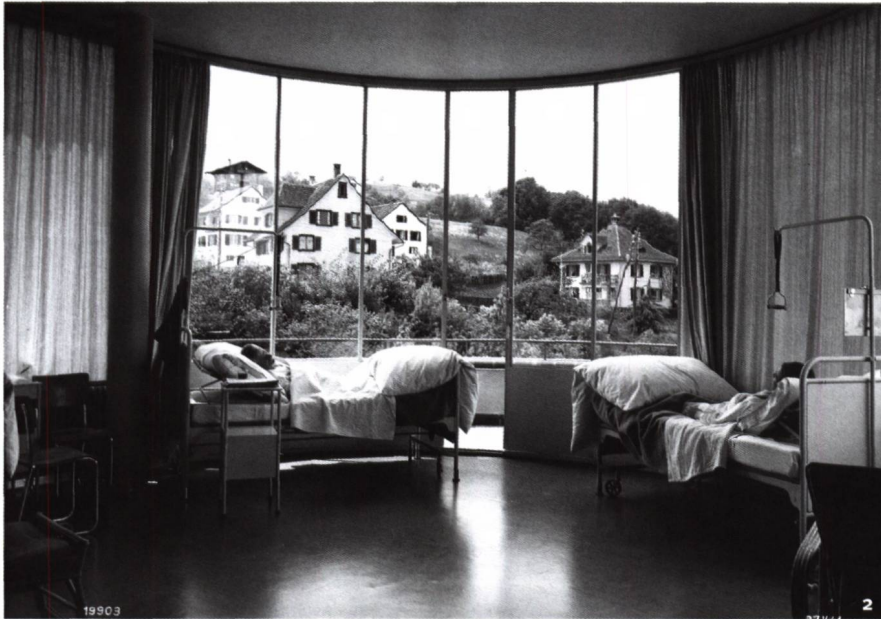
Abb. 2 Tagesraum-Interieur für Patienten, ehemaliges Bezirksspital Wädenswil, Mai 1941.

Intérieur de la salle de jour pour les patients, ancien hôpital régional de Wädenswil, mai 1941.