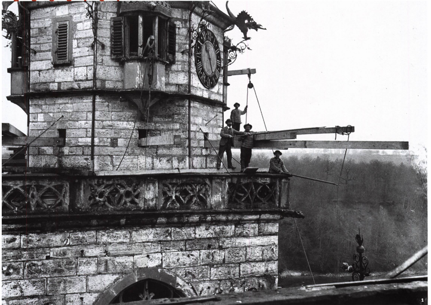
Abb. 1 Beginn der Restaurierungsarbeiten am Südturm der ehemaligen Kloster- kirche Rheinau im Dezember 1900, eine der ältesten Aufnahmen im Photoarchiv.

Début des travaux de restauration de la tour sud de l'ancienne église du monastère de Rheinau en décem- bre 1900: l'une des plus anciennes photographies des archives.