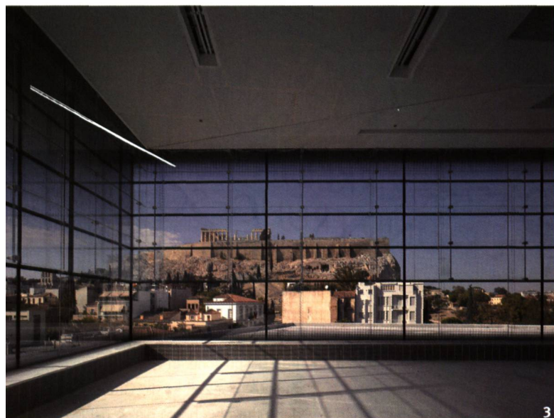
Fig. 3 L'enveloppe transparente de la galerie supérieure assure une vue directe sur le Parthénon.

la période archaïque jusqu'au romain tardif. L'édifice est enfin couronné d'une galerie de verre rectangulaire, aménagée autour d'une cour intérieure. C'est dans cette galerie que doivent être exposées les sculptures du Parthénon.