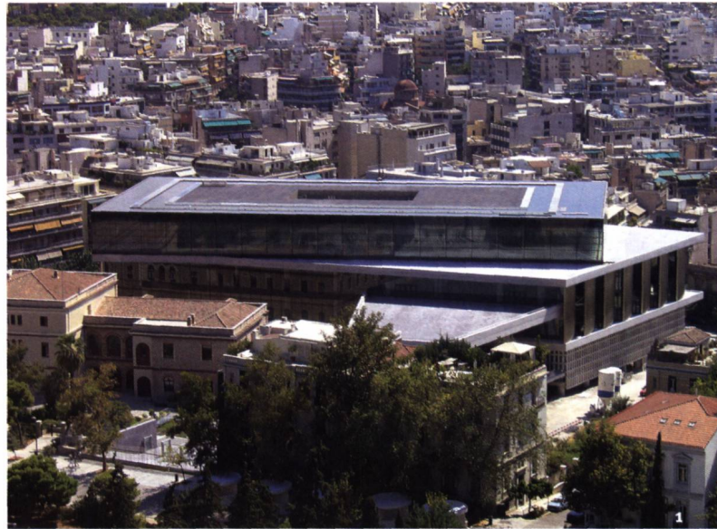
Fig. 1 Le Nouveau Musée de l'Acropole à Athènes, construit par l'architecte suisse Bernard Tschumi au cœur du quartier historique de Makryianni.

Initié en 1976, ce projet fait suite à la volonté des autorités grecques de rendre au sanctuaire athénien son apparence antique. Un vaste programme de restauration des monuments de l'Acropole, en cours à l'heure actuelle, avait alors été lancé afin de remédier aux dommages du temps, de la pollution atmosphérique et d'utilisations inappropriées. A cette occasion, de nombreuses sculptures avaient été détachées des monuments et transférées au Musée de l'Acropole. Elles y étaient depuis exposées dans un espace de moins de 1400 m 2 , sous un éclairage artificiel. La construction d'un nouvel écrin pour accueillir ces chefs-d'œuvre de l'art archaïque et classique s'avérait donc nécessaire.