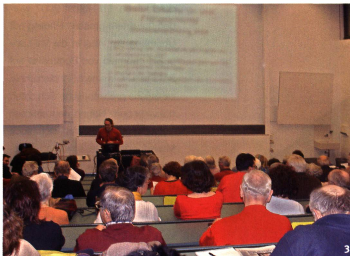
Abb. 3 Vortrag im Kollegiengebäude der Universität Basel.

laufenden Grabungen, zu archäologischen Sehenswürdigkeiten oder zu Museumsausstellungen auf dem Programm. Die Planungs- und Gestaltungsmöglichkeiten des Basler Zirkels sind – wie bei den meisten Vereinen – von den finanziellen Möglichkeiten abhängig. Die jährlichen Mitgliederbeiträge (CHF 45.- für ordentliche Mitglieder und CHF 20.- für Studierende) bilden hierbei das zentrale Fundament. Oft darf sich unser Verein auch über Gönnerbeiträge und andere Zuwendungen freuen.