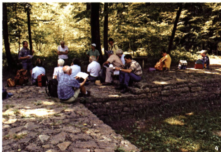
Abb. 4 Vereinsmitglieder auf einer Wanderexkursion entlang des Rheins.