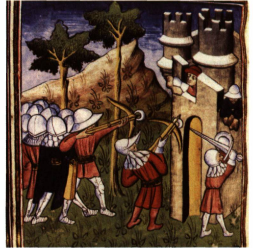
Grosse Chronik Frankreichs bis 1380, «Angriff auf eine bretonische Burg», Malerei aus Frankreich, um 1375-1400.