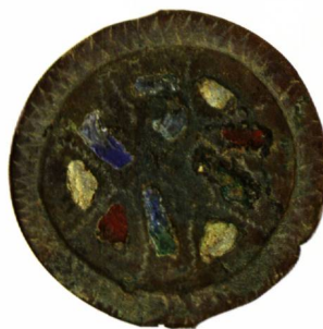
Abb. 13 Scheibenfibel mit Emailleinlage des Typs Agnus Dei aus dem 11. Jh. Durchmesser 29 mm.

Ein aussergewöhnliches Objekt stammt aus demselben Kontext, also aus dem Nutzungshorizont der Holzbefestigung: Es handelt sich um eine Scheibenfibel mit Emailleinlage, die möglicherweise zu einer Fibel des Typs Agnus Dei gehört. Von der Seltenheit dieser zum Gewandschmuck gehörenden Fibeln einmal abgesehen, ist der Fund im Kontext der Burg von Rouelbau deshalb interessant, weil der fragliche Typ eigentlich ins 11. Jh. datiert wird. Es stellt