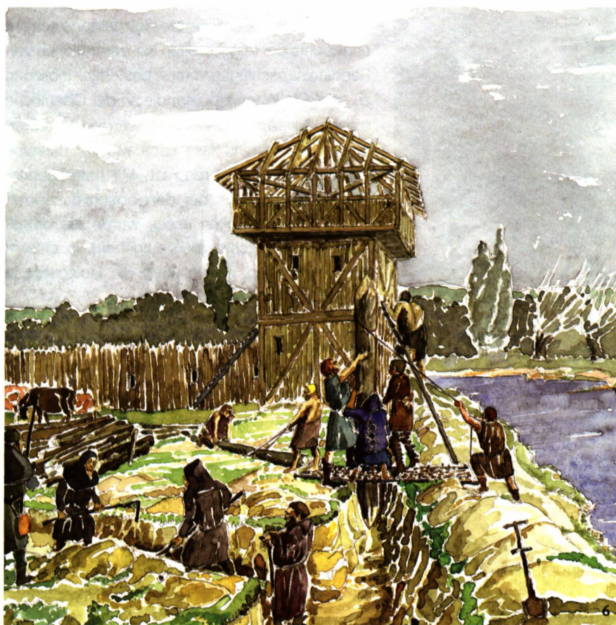
Abb. 6 Rekonstruktion der Baustelle der Holz-/Erdburg im Sommer 1318.

Estate 1318: restituzione del cantiere di costruzione della struttura in legno.