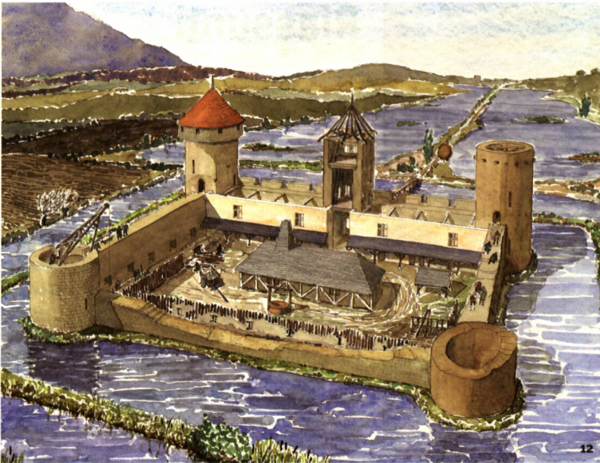
Abb. 12 Rekonstruktion der Baustelle der Steinburg, mit dem noch in Benutzung stehenden älteren Holzgebäude innerhalb der Umfassung.

Ricostruzione del cantiere di costruzione del castello in muratura con il mantenimento dell'elevato in legno all'interno delle nuove mura fortificate.