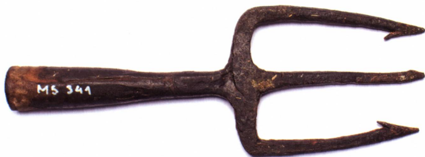
Abb. 3 Mit eisernen Fischgeräten wurden noch bis ins 20. Jahrhundert Fische gestochen. Dreizack aus der Sammlung Schwab.

Les tridents en fer ont été encore utilisés jusqu'au 20 e siècle pour la pêche. Trident de la collection Schwab.