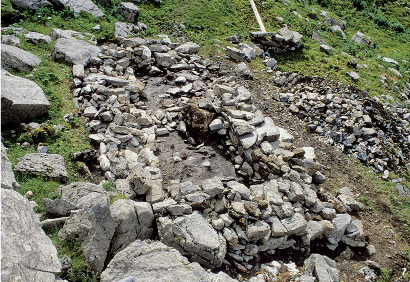
Abb. 7 Melchsee-Frutt-Kerns (OW). 1920 m ü.M. Wüstungsplatz Müllerenhütte. Zweiräumiges Gebäude G7, von NW. Im Vordergrund der Raum zum Kaltstellen der Milch, im Hintergrund die «Käserei» mit Feuerstelle und stirnseitigem Zugang.

Melchsee-Frutt-Kerns (OW). 1920 m s.m. Plaz da desertificaziun Mülleren- hütte. Edifizi da duas stanzas G7, da nordvest. En la part davant il local per tagnair frestg il latg, en il fund la «chascharia» cun fuaina ed entrada da la vart frontala.