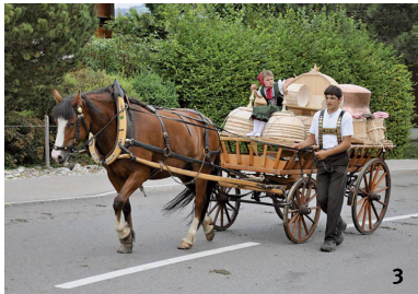
Abb. 3 Alpabfahrt im Jahr 2009 in Appenzell (AI). Der so genannten Lediwagen ist vollbeladen mit blendend weiss geschrupptem hölzernem Milchgeschirr, einem Butterfass und einem kupfernen Käsekessel – dem einzigen Gegenstand aus Metall.

Descensiun da l'alp l'onn 2009 ad Appenzell (AI). L'uschenumnà «Lediwagen» è chargià cun vaschs da latg da lain barschunads resch alv, ina panaglia ed ina chaldera d'arom – il sulet object da metal.