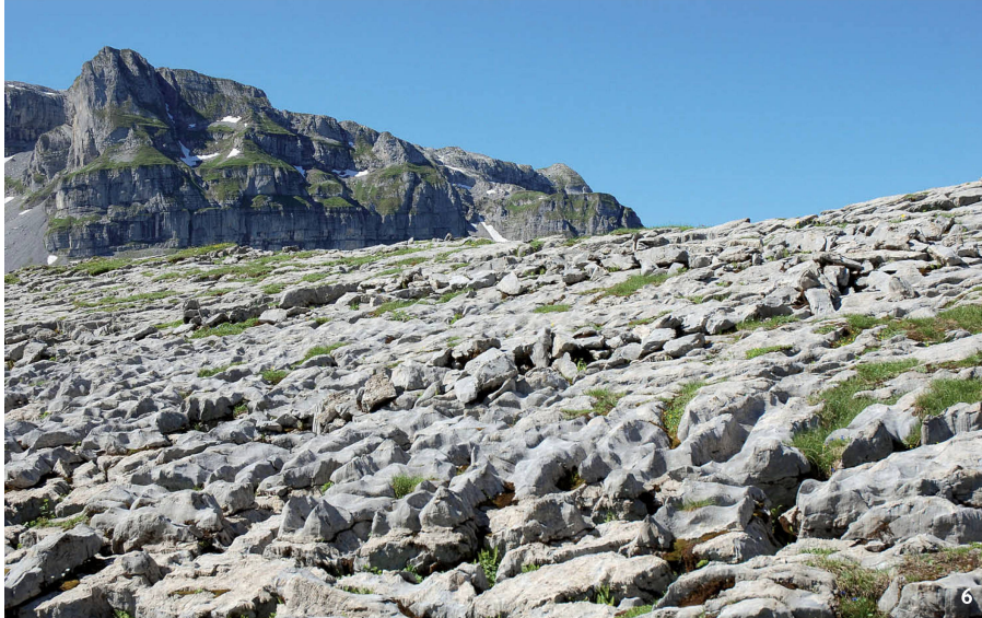
Abb. 6 Muotathal-Glattal (SZ). 1890 m ü.M. Reste einer ehemaligen Pferchmauer auf blanken Karrenfelsen.

Muotathal-Glattal (SZ) 1890 m s.m. Restanzas d'in anteriur claus da mir sin grip glazial niv.