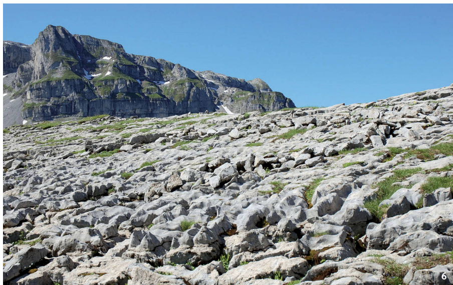
Fig. 6 Muotathal-Glattalp (SZ). 1890 m slm. Rovine di un antico stabbio su terreno calanchivo.

Muotathal-Glattalp (SZ). 1890 m. Vestiges d'un mur d'enclos sur le lapiaz (rocher mis à nu et attaqué par les eaux de ruissellement).