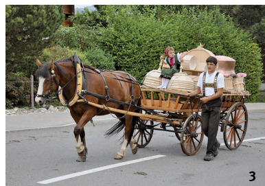
Fig. 3 Demonticazione ad Appenzello (AI) nel 2009. Il cosiddetto Lediwagen è caricato al massimo con recipienti lignei per la produzione casearia perfettamente lustrati, una botte per il burro e, quale unico oggetto di metallo, un calderone di rame per il formaggio.

Désalpe à Appenzell (AI) en 2009. Le char, appelé Lediwagen, est rempli à ras bord d'ustensiles pour la fabrication du fromage: récipients en bois reluisants, soigneusement nettoyés à la brosse, baratte à beurre et chaudron en cuivre, seul objet en métal de ce chargement.