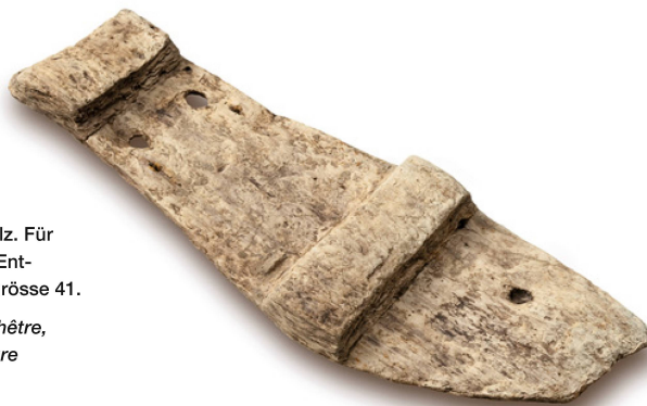
Abb. 14 Badesandale aus Buchenholz. Für den linken Fuss gearbeitet. Entspricht der heutigen Schuhgrösse 41.

Am Kastellweg diente ein Fass mit ausgeschlagenem Boden im mittleren 1. Jh. vermutlich als Ausfachung eines Brunnenschachts. Es befand sich im Hinterhof eines Wohnhauses und war von diesem über einen gekiesten Trampelpfad zu erreichen (Abb. 15). Obwohl es bei der Entdeckung zunächst gar nicht so aussah, war die Holzerhaltung der 16 Fassdauben überraschend gut. Es handelt sich damit um das einzige bisher bekannte Fass aus dem Vicus, das in seiner ursprünglichen Länge wiederverwendet wurde. Die Länge der Dauben, die grösstenteils aus Fichtenholz bestanden, betrug noch 1,85 m, die Breite 15-18 cm mit bis zu 3 cm Dicke. Die Bretter waren von neun Ringen aus Haselruten umwickelt, so dass sie einen Durchmesser von 70 cm oben und 80 cm unten bildeten. Das ursprüngliche Fassungsvermögen muss mindestens 817 Liter betragen haben. Die Haselzweige waren angeschrägt, damit sie besser auf dem