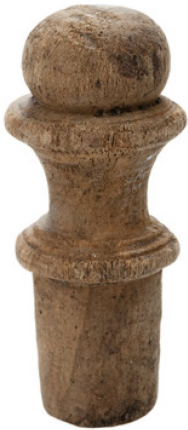
Abb. 12 Flaschenstöpsel, gedrechselt aus Buchsbaumholz. Länge 4,3 cm.

Petit bouchon de flacon en buis tourné. Long. 4,3 cm.