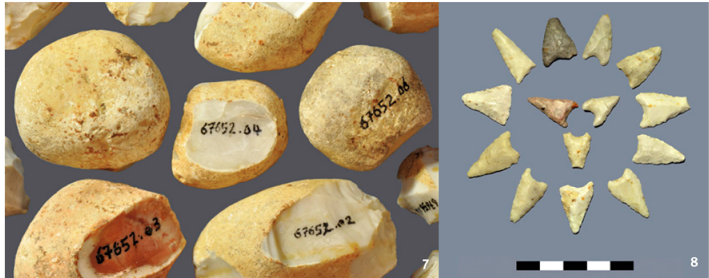
Abb. 8 Büttenhardt-Zelg. Auswahl neolithischer Pfeilspitzen. Auffallend sind die Asymmetrie sowie die unregelmässigen Kantenverläufe mit teils gut erkennbaren Ausbrüchen. Sie rühren wohl teilweise vom Gebrauch her. Skala in cm.

Büttenhardt-Zelg. Alcuni rognoni di selce in diversi stadi di lavorazione. Diametro del pezzo in alto a sinistra: 3,4 cm.