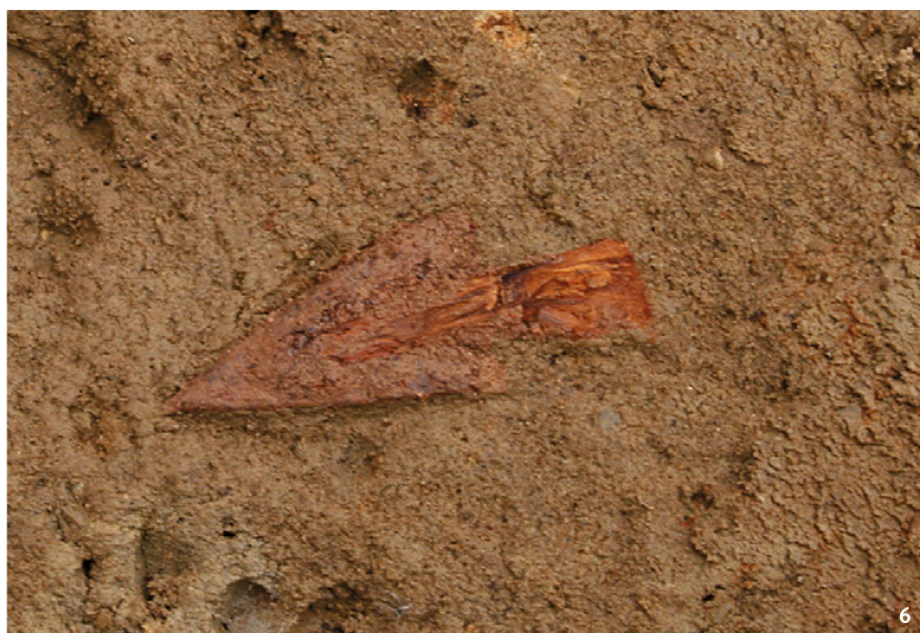
Abb. 6 Eiserne Pfeilspitze (Länge ca. 3 cm) in Fundlage mit anhaftenden Resten des Holzschafths.

Pointe de flèche en fer (longueur env. 3 cm) lors de sa découverte, avec des restes de bois de sa hampe.