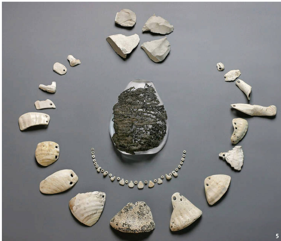
Abb. 5 Netzbeutel mit Inhalt aus Egolzwil 3. Anhänger aus Schneckenschalen (Triton), Steinperlen und Silexab- schlägen.

Sachet en filet du site d'Egolzwil 3 et son contenu. Pendentifs en coquille d'escargots de mer (triton), perles de pierre et déchets de taille de silex.