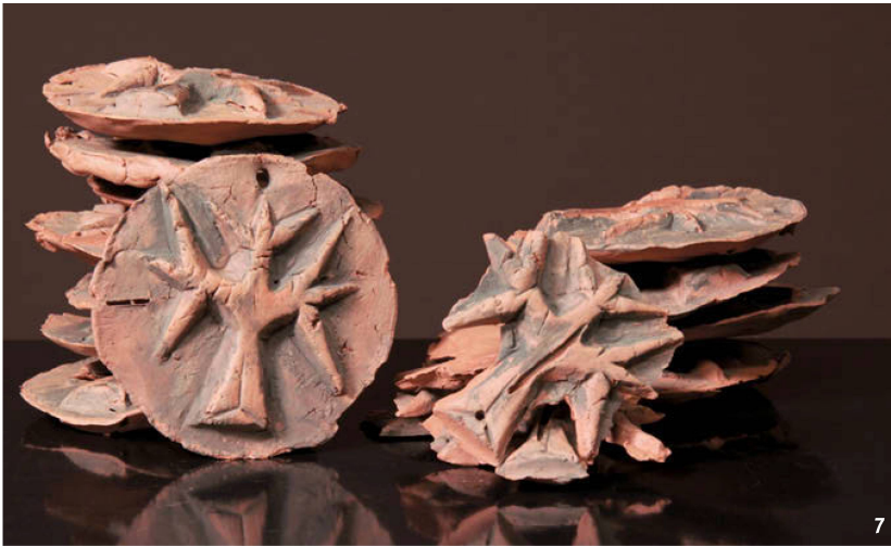
Fig. 7 Amulettes en argile crue du Brazulien récent (7 e siècle apr. J.-C.), figurant un arbre.

Amulette aus ungebranntem Ton mit Baum-Darstellungen aus der späten Brazulien-Kultur (7. Jh. n.Chr.).