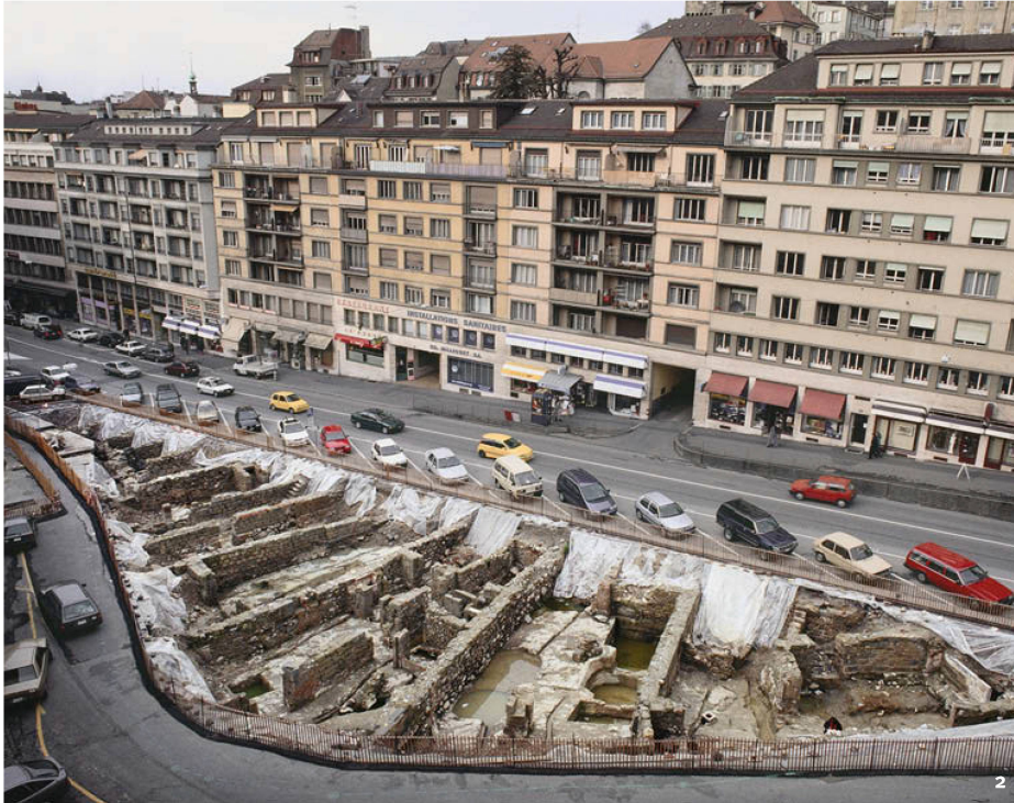
Fig. 2 Lausanne – Rôtillon. Les fouilles de 1996 ont révélé l'histoire d'un quartier au bord du Flon, du Moyen Age au 20 e siècle.

Losanna – Rôtillon. Gli scavi del 1996 hanno messo in evidenza la storia di un quartiere lungo il Flon, tra il Medioevo e il XX secolo.