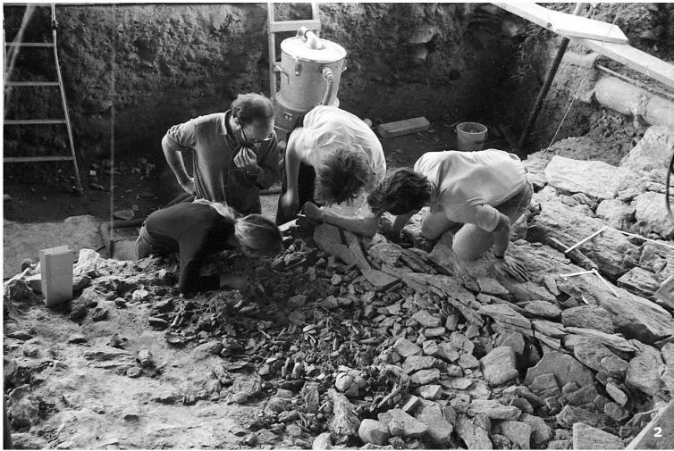
Fig. 2 Sion, Petit-Chasseur I, 1971. Déga- gement d'un amas d'os humains brûlés déposés dans une fosse le long du soubassement du dolmen M VI.

Sion, Petit-Chasseur I, 1971. Freilegen einer Ansammlung verbrannter menschlicher Knochen, die in einem Graben längs des Fundaments von Dolmen M VI zum Vorschein kamen.