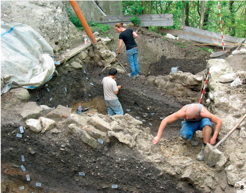
Abb. 8 Bei den flächig aufeinander gestapelten grossen Steinen könnte es sich um einen frühbronzezeitlichen Wall handeln. Leider wurden sie in der Umfassungsmauer des Schlosses (rechts) wiederverwendet.

Les grosses pierres étalées sur la surface devaient appartenir à une fortification du Bronze ancien. Elles ont malheureusement été récupérées pour la construction du mur d'enceinte du château (visible à droite).