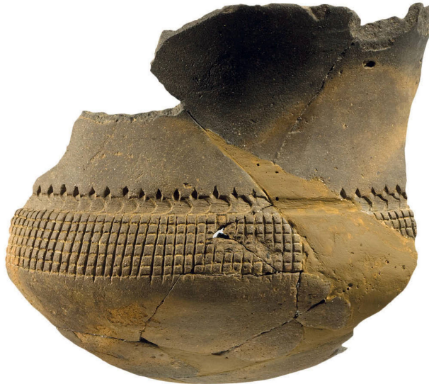
Abb. 6 Dieser gut erhaltene Becher des Typ Borscht-Inzigkofen stammt aus einer Grube aus der Horgener Zeit. Ce gobelet du type Borscht-Inzigkofen provient d'une fosse datée de l'époque du Horgen. Questo bicchiere ben conservato, del tipo Borscht-Inzigkofen, proviene da una fossa della cultura di Horgen.

ins spätere Horgen datiert werden. Wiederum wurden mehrheitlich aber Funde aus den Vorgängersiedlungen in den Schichten sekundär abgelagert. In einer im Horgen aufgefüllten Grube fand sich sogar ein gut erhaltener Schulterbecher, der sich dem Typ Borscht-Inzigkofen zuweisen lässt.