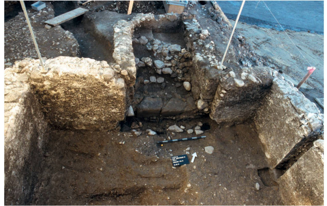
Gemauerter Keller aus dem 13./14. Jh.: Zu sehen sind unter anderem Reste der Treppe und eine Aussparung für eine hölzerne Innenstütze (rechts).

Umkreis einer Hitzequelle – beispielsweise beim Kachelofen – vermag aber nicht zuletzt wegen der Grösse der Backsteine nicht zu überzeugen. Simon Maier, Andrea Rumo