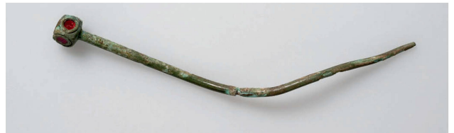
Unterwegs verloren: Die Bronzenadel mit Polyederkopf und Glaseinlagen aus der ersten Hälfte des 7. Jh. wurde nicht wie üblich in einem Grab, sondern als Streufund entdeckt (Länge 10 cm).

Cantina murata del XIII-XIV secolo: si notano tra l'altro i resti di una scala e l'incavo per un sostegno interno di legno (a destra).