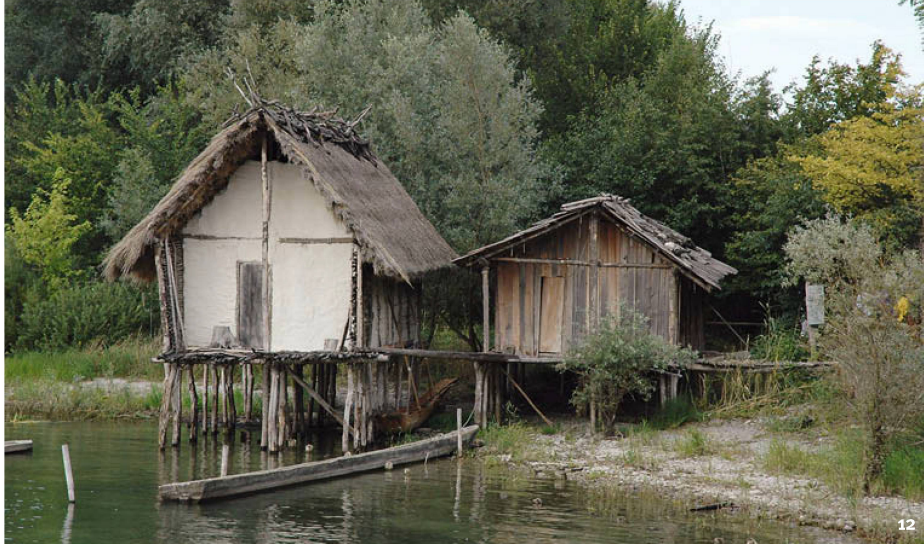
Abb. 12 Die Pfahlbauhäuser von Hornstaad (links) und Arbon-Bleiche 3 (rechts) im Pfahlbaumuseum Unteruhldingen. Aufnahme 2005.

Les maisons sur pilotis de Hornstaad (D), à gauche, et de Arbon-Bleiche 3 (TG), à droite, au musée d'Unteruhldingen (D). Prise de vue de 2005.