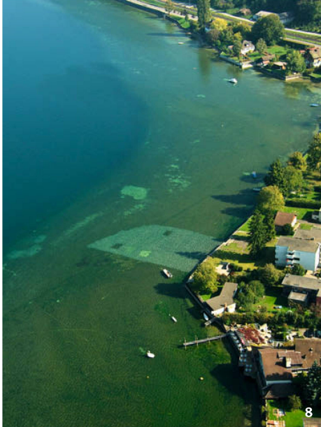
Abb. 8 Die Kiesabdeckung der Fundstellen in der Schanz bei Steckborn zeichnet sich deutlich ab.

La couverture de graviers du site de Schanz près de Steckborn (TG) est clairement visible sur l'image.