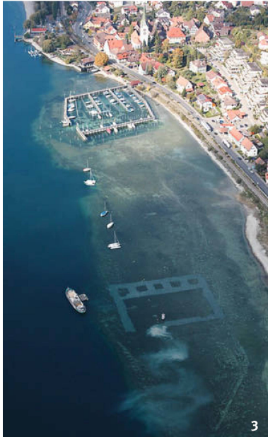
Abb. 3 Kiesschüttung vor Sipplingen (D). Im Rahmen des Interreg IV-Projektes wurden an verschiedenen Fundstellen Kiesschüttungen ausgebracht und mit verschiedenen Methoden deren Einfluss auf Flora und Fauna überprüft. Im weiteren wurde das Verhalten der Kieskörper auf Strömungen abgeklärt.

Remblai de graviers en aval de Sipplingen (D). Dans le cadre du projet Interreg IV, la pose de remblais de graviers sur divers sites a été testée, ainsi que, selon différentes méthodes, son influence sur la flore et la faune. La réaction aux courants de ces couches a par ailleurs été clarifiée.