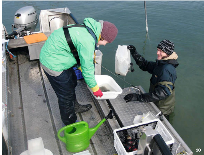
Abb. 10 Arbeiten des Limnologischen Institutes der Universität Konstanz in Steckborn-Schanz.

Travaux de l'institut de limnologie de l'Université de Constance à Steckborn-Schanz.