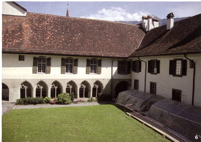
Abb. 6 Der spätgotische Konventflügel Ost mit erhaltenem Kreuzgangarm. Die Fassadenmauer dahinter stammt noch vom Vorgängergebäude des frühen 12. Jahrhunderts.

L'aile est du couvent de la fin de l'époque gothique, avec la galerie du cloître conservée. Le mur de façade à l'arrière appartient à l'édifice antérieur du début du 12 e siècle.