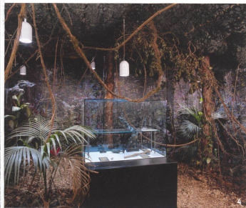
Fig. 4 Da Vidy Code. Chiard l'oses pas! Une expo sur les peurs humaines, ici celle de la nature hostile (2006).

Da Vidy Code. Chiard l'oses pas! Eine Ausstellung über menschliche Ängste, hier jene der feindlichen Natur (2006).