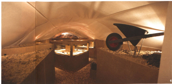
Fig. 6 Déçus en bien. Trouvailles archéologiques en terre vaudoise. Une plongée dans le sous-sol cantonal (2009).

Mais la démarche muséographique du Musée romain de Lausanne-Vidy n'a pas pour unique moteur la nécessité pratique d'être distinct. Elle se fonde aussi sur une approche critique de la discipline archéologique et de son volet muséal. D'abord, le temps d'une archéologie de collectionneurs étant – comme chacun sait – révolu