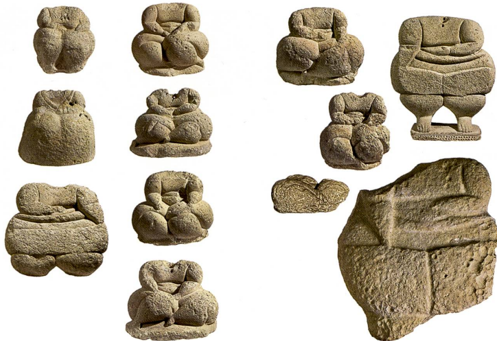
Abb. 6 Diese Statuetten stammen aus der Tempelanlage von Hagar Qim, Qrendi. Die Korpulenz ist charakteristisch für viele anthropomorphe Figuren des maltesischen Neolithikums. Die Vertiefung im Halsbereich sowie die Löcher ermöglichten vermutlich die Befestigung auswechselbarer Köpfe.

Statuettes provenant du sanctuaire de Hagar Qim, Qrendi. La corpulence est caractéristique de bien des représentations anthropomorphes du Néolithique maltais. Le creux et les perforations dans la région du cou suggèrent que les têtes étaient interchangeables.