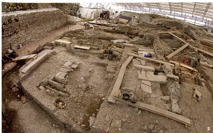
Fig. 2 Esplanade de Saint-Antoine, galerie ouest de l'église avec ses pierres tombales, vue du nord.