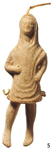
Fig. 5 Pantin en terre cuite à jambes mobiles.

A La Tour-de-Peilz, les visiteurs sont invités à essayer les jeux présentés: une miniludothèque les attend dans l'exposition, conçue pour