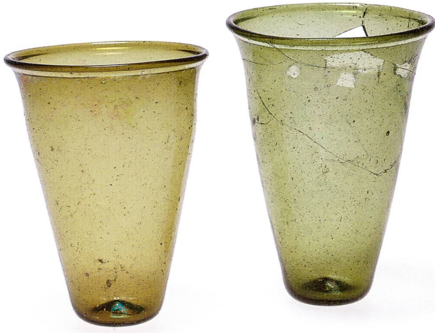
Abb. 20 Basel-Theodorskirchplatz 7, 2010/11, die Trinkgläser aus den Kindergräbern 1 (links) und 6.

Basilea-Theodorskirchplatz 7, 2010/11, bicchieri rinvenuti nelle sepulture di bambino 1 (a sinistra) e 6.