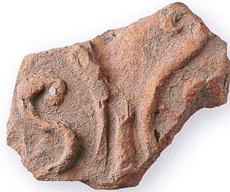
Frammento di un antifex (tegola ornamentale) con palmette stilizzate e fiori di giglio. Questo tipo di tegola ornava, di regola, gli edifici pubblici.