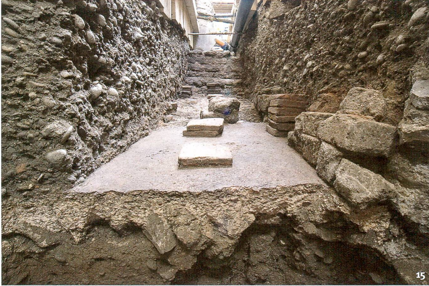
Fig. 15 Coupe à travers l'hypocauste d'une confortable maison en pierre d'époque romaine tardive, vue vers le nord.

Sguardo da nord sui pilastri dell'ipocausto di un edificio in muratura ben equipaggiato di epoca tardo-romana.