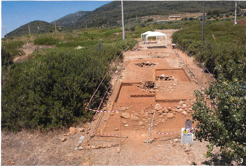
Abb. 3 Das Grabungsareal Strada. Im Hintergrund links der Siedlungshügel Timpone Motta.

Le secteur de fouille Strada. A l'arrière-plan, à gauche, la colline de Timpone Motta, sur laquelle se trouve l'habitat.