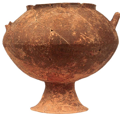
Abb. 7 Scheibengedrehtes Gefäss auf hohem Fuss aus Grab Strada 2. H. 36 cm.

Das Grab ist vom selben Typus wie das vorangegangene, jedoch etwas grösser und sorgfältiger konstruiert. Es enthielt die schlecht erhaltenen Reste einer rund 20-30 jährigen Frau, deren Tracht aus mehreren Bronze- und Eisenfibeln sowie einem mit hunderten von kleinen bronzenen Zierknöpfen bestickten Schleier oder Kopfputz bestand. Das Geschirrsset setzt sich aus einem grossen bauchigen Gefäss auf hohem Fuss und einer kleinen Schöpftasse in ihrem Inneren zusammen. Anders als die sonst in den Gräbern des 8. Jh. v.Chr. vorherrschende handgetöpferte Keramik, ist das grosse Gefäss auf der Drehscheibe gefertigt. Sein hoher Fuss und auch die weite Mündung verraten, dass sich der Töpfer an fremden Gefässformen orientiert hat, namentlich an griechischen Krateren, die seit der Mitte des 8. Jh. v.Chr. nach Italien exportiert und – auch in Francavilla – lokal imitiert wurden. Im vorliegenden Fall hat der Töpfer sein Vorbild jedoch nicht eins zu eins nachgeahmt, sondern es mit der bauchigen, bikonischen Form der einheimischen Olla kombiniert. Das Ergebnis ist ein hybrides Gefäss, das Einheimisches mit Fremdem verbindet und damit auch die Frage nach seiner Funktion aufwirft. Die kleine Tasse, die im Innern gefunden wurde, verrät dass sich das Keramikensemble an der einheimischen Beigabentradition orientiert. Gleichzeitig manifestieren sich in der Aneignung von Merkmalen des griechischen Symposiongeschirrs erste Kenntnisse einer neuen Trinkkultur.