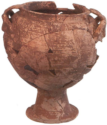
Abb. 11 Der Krater aus Grab De Leo 1. H. ca. 40 cm.

Le cratère de la tombe De Leo 1. H. env. 40 cm.