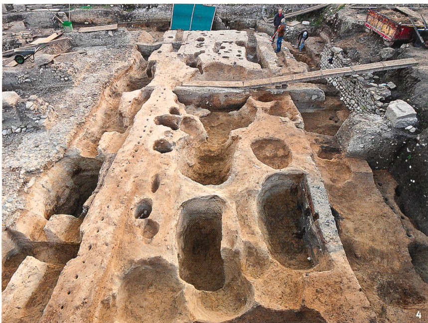
Fig. 4 Les fouilles réalisées en 2014 au pied de la colline d'Avenches (route du Faubourg) ont livré un ensemble de fosses, de fossés et de palissades ainsi qu'un très riche mobilier de La Tène D2.

Die 2004 durchgeführten Grabungen am Fuss des Hügels von Avenches (route du Faubourg) haben ein Ensemble von Gräbern, Gräben und Palisaden sowie reiche Funde aus der jüngeren Eisenzeit (Latène D2) zutage gebracht.