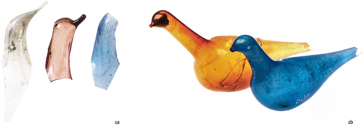
Fig. 1 Flacons à parfum en forme d'oiseaux. Fragments récoltés dans l'atelier de Derrière la Tour (a) et oiseaux presque intacts mis au jour au Tessin (b). Milieu 1 er s. apr. J.-C.

Balsamari a forma di uccello. Frammenti raccolti nell'officina di Derrière la Tour (a) e colombine quasi intatte portate alla luce in Ticino (b). Metà del I sec. d.C.