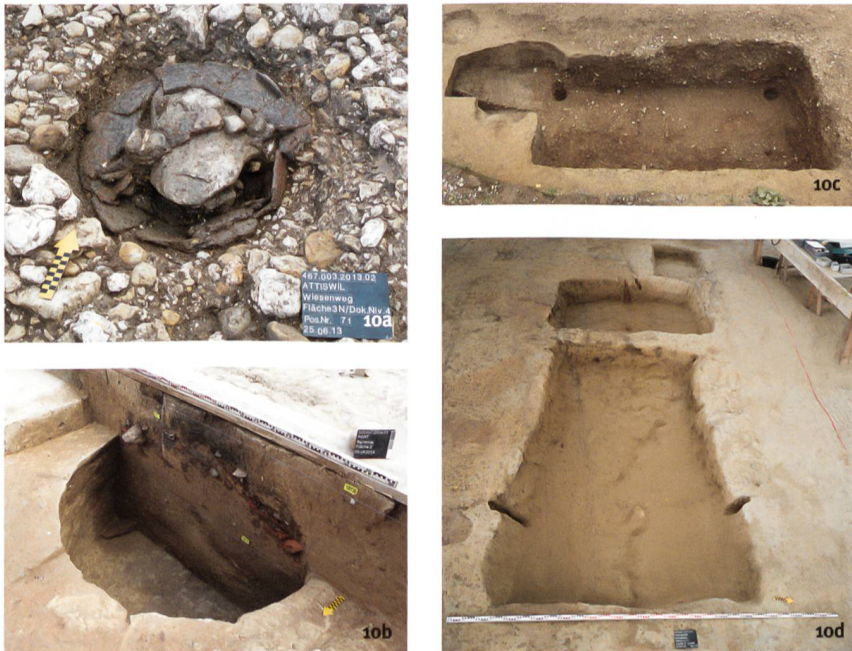
Fig. 10 Exemples de stockage en milieu froid et humide dans les habitats ruraux. a) Attiswil, Wiesenweg 15/17. Récipient de stockage de l'âge du Bronze. b) Port, Bellevue. Fosse de La Tène pour le stockage des céréales. c) Biel, Gurzele. Cave du Moyen Age central creusée dans la terre, revêtue d'un coffrage de bois. d) Kirchdorf, Winkel. Fosse-silo de la fin de l'époque moderne.

Sistemi di conservazione in ambiente umido e fresco degli insediamenti rurali. a) Attiswil, Wiesenweg 15/17. Recipiente per provviste dell'età del Bronzo. b) Port, Bellevue. Fossa dell'epoca di La Tène per lo stoccaggio di cereali. c) Biel, Gurzele. Cantina interrata rivestita di legno. d) Kirchdorf, Winkel. Fossa di stoccaggio moderna.