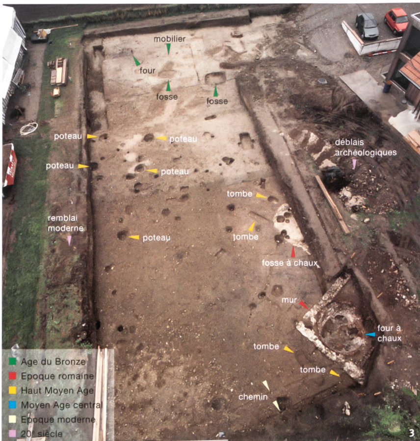
Fig. 3 Köniz, Niederwangen Stegenweg 3-5. Des structures archéologiques de diverses époques caractérisent ce site.

Köniz, Niederwangen Stegenweg 3-5. Il sito è caratterizzato dalla presenza di contesti archeologici di epoche distinte.