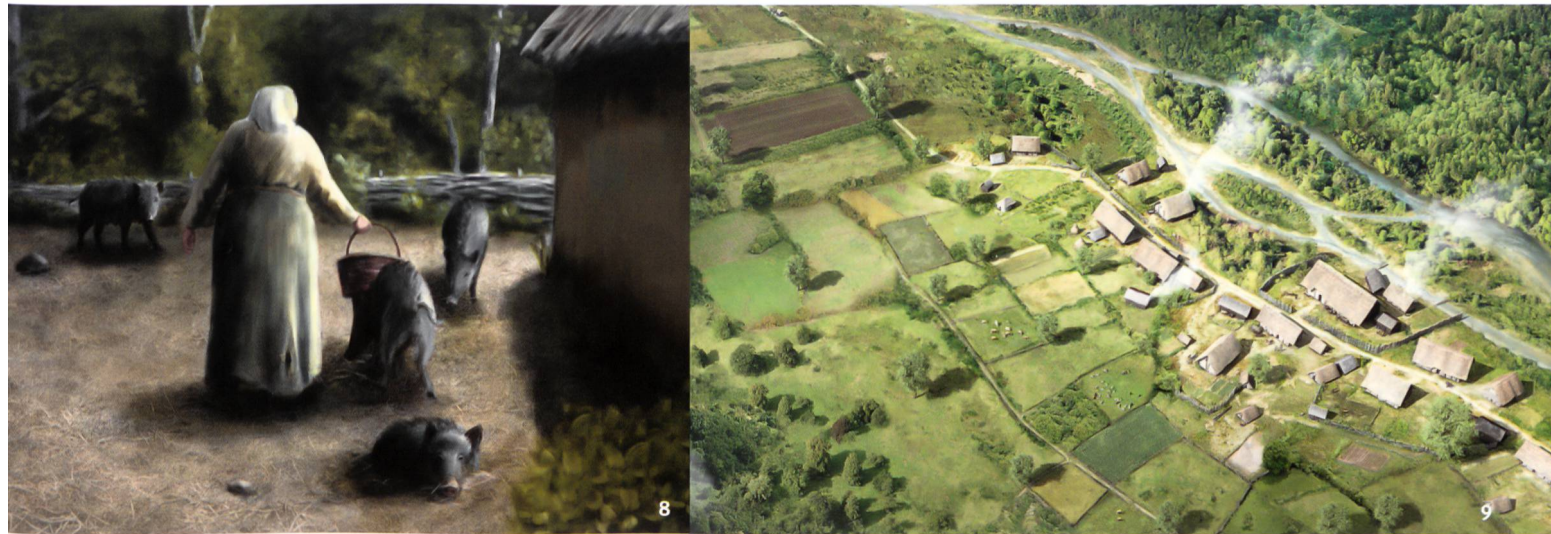
Abb. 8 Bäuerlicher Alltag in der frühmittelalterlichen Siedlung bei Sursee-Mülihof. Die Natur und der menschliche Lebensraum sind nah beieinander.

Scène de la vie paysanne dans l'habitat du Haut Moyen Age de Sursee-Mülihof. La nature et le cadre de vie des hommes sont étroitement liés.