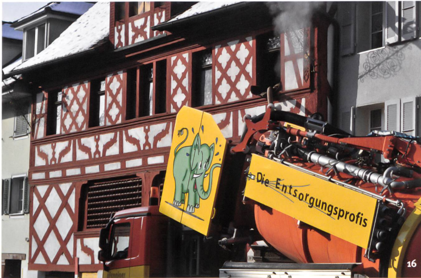
Abb. 16 Sempach, Rathaus 2013. Selbst Umbau- und Restaurierungsarbeiten in wichtigen Gebäuden können nicht konsequent bauhistorisch begleitet werden. Blick nach Süden.

Sempach, l'Hôtel de Ville en 2013. Même les travaux de transformation et de restauration dans des bâtiments aussi importants ne peuvent être accompagnés de manière adéquate.