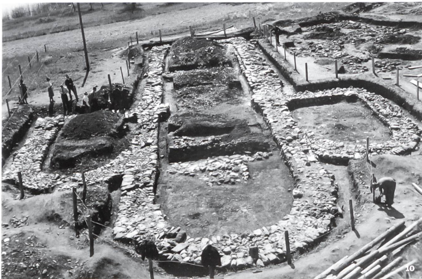
Abb. 10 Sursee-Landzunge Zellmoos 1941. Freigelegte Fundamente einer Kirche des 11. Jh. Im Vordergrund die Hauptapsis. Blick nach Südwesten.

Sursee-Presqu'île de Zellmoos, 1941. Les fondations entièrement dégagées d'une église du 11 e siècle. Au premier plan, l'abside principale. Vue vers le sud-ouest.