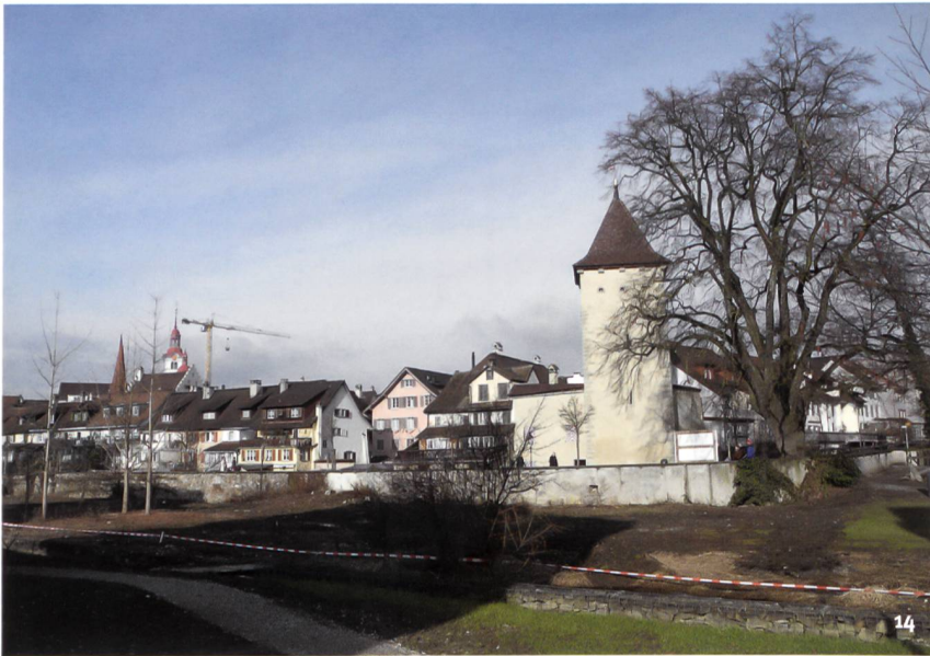
Abb. 14 Sursee. Äussere Stadtbefestigung und Diebenturm an der südwest- lichen Ecke der Stadtanlage 2014. Blick nach Norden.

Sursee. Le rempart extérieur en 2014, avec la Diebenturm («tour des voleurs») à son angle sud-ouest. Vue vers le nord.