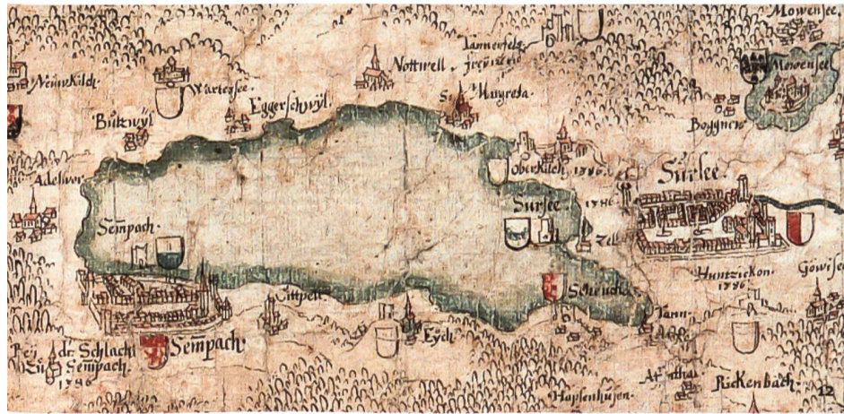
Abb. 12 Darstellung des Sempachersees auf der Luzerner Karte von Hans Heinrich Wägmann und Renward Cysat, 1597-1613. Sempach und Sursee sind als Stadtanlagen deutlich hervorgehoben.

Représentation du lac de Sempach sur la carte de Lucerne de Hans Heinrich Wägmann et Renward Cysat, 1597-1613. Sempach et Sursee sont clairement figurées comme des villes, avec leurs fortifications.