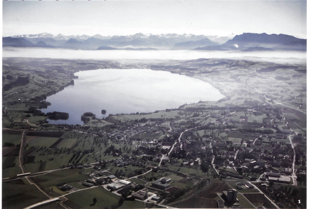
Abb. 1 Der Sempachersee und die umliegende Landschaft 1976. Im Vordergrund Sursee, im Hintergrund die Zentralschweizer Alpen. Blick nach Südosten.

Le lac de Sempach et ses alentours en 1976. Au premier plan Sursee, à l'arrière les Alpes de Suisse centrale. Vue vers le sud-est.