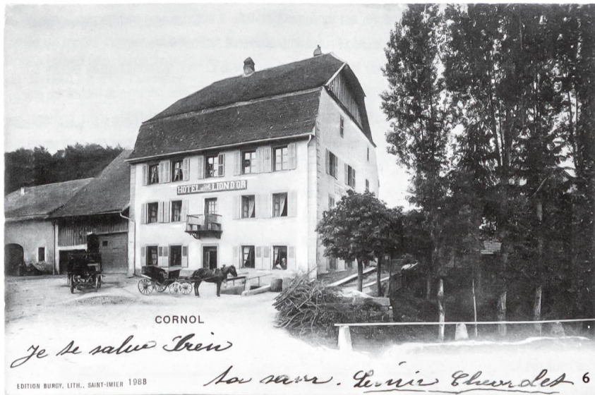
Fig. 6 L'ancienne faïencerie, devenue entre-temps l'hôtel du Lion d'Or, vue de la route principale vers l'ouest, aux environs de 1900. Les fours se trouvaient à l'emplacement du bâtiment attenant sur la gauche (carte postale, collection Y. Rondez).

Die frühere Fayencemanufaktur wurde zwischenzeitlich zum Hotel Lion d'Or. Ansicht von der Hauptstrasse gegen Westen um 1900. Die Brennöfen standen an der Stelle des angrenzenden Gebäudes links im Bild. (Postkarte aus der Sammlung Y. Rondez).