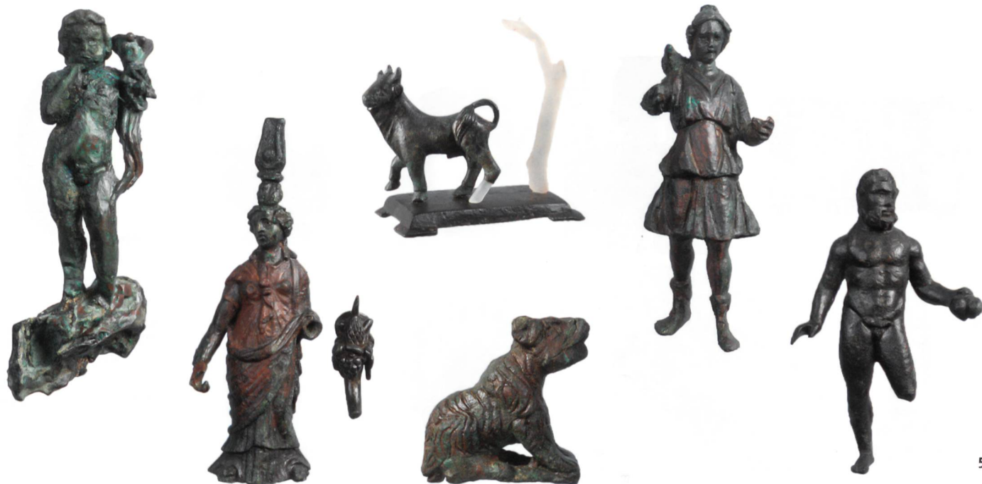
Fig. 5 Le laraire de Vallon – Sur Dompierre (FR) se compose d'une quinzaine de statuette en bronze de divinités celtiques, gréco-romaines et égyptiennes.

Das Lararium von Vallon – Sur Dompierre (FR) besteht aus 15 Bronzestatuetten von griechisch-römischen, ägyptischen und keltischen Gottheiten.