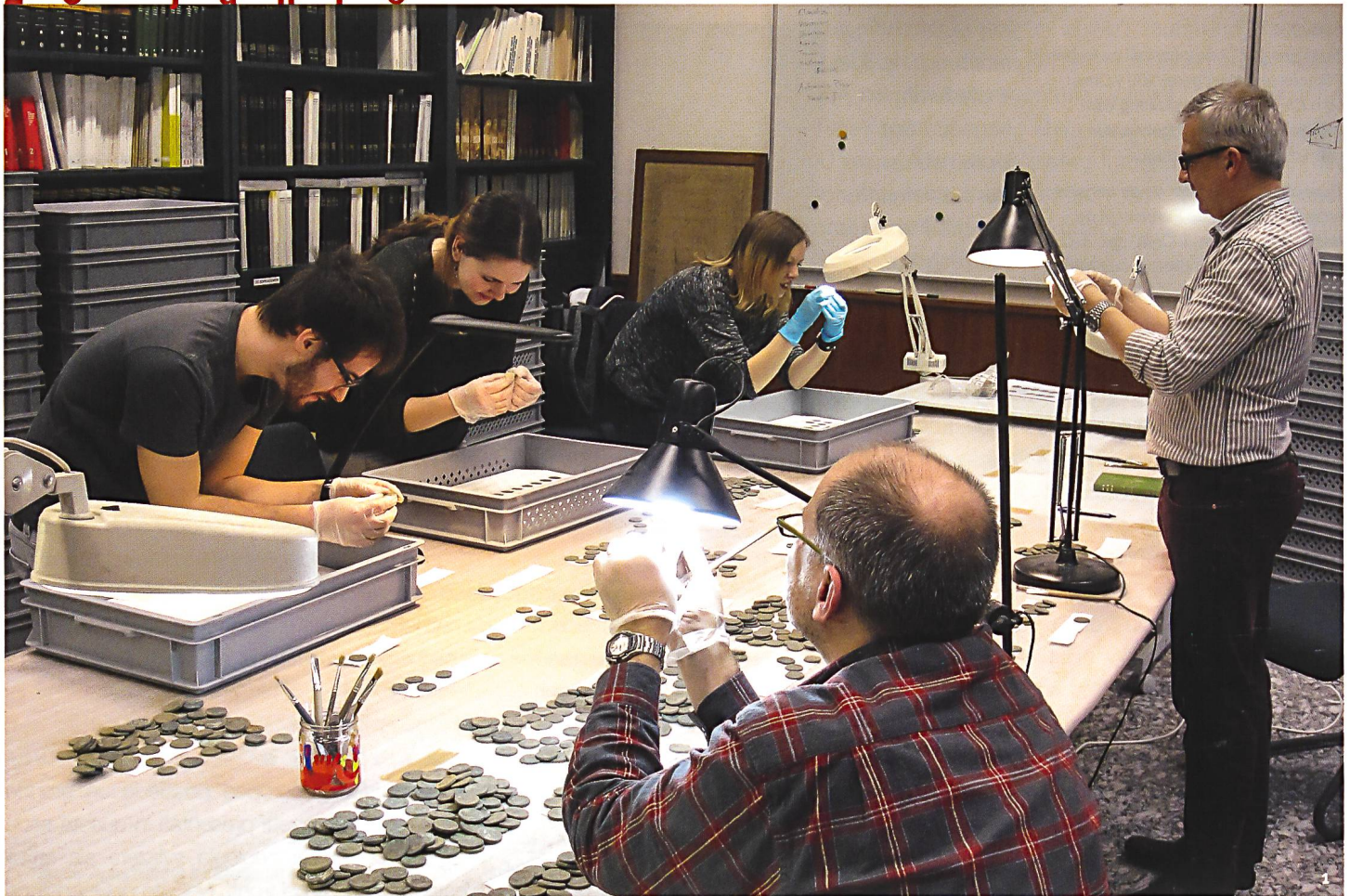
Abb. 1 Hort von Orselina TI: Das IFS hat 2015/2016 im Auftrag des Ufficio dei beni culturali in Bellinzona eine erste Sortierung und die archäologisch-numismatische Einordnung der über 4800 römischen Sesterzen vorgenommen.

Trésor d'Orselina TI: en 2015-2016, l'ITMS a entrepris, sur mandat de l'Ufficio dei beni culturali à Bellinzone, le tri et le classement archéologique et numismatique préliminaire des plus de 4800 sesterces romains mis au jour.