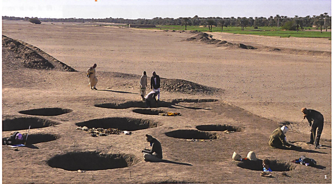
Fig. 1 Fouille dans l'un des plus anciens secteurs de la nécropole de Kerma.

Ausgrabung in einem der ältesten Bereiche der Nekropole von Kerma.