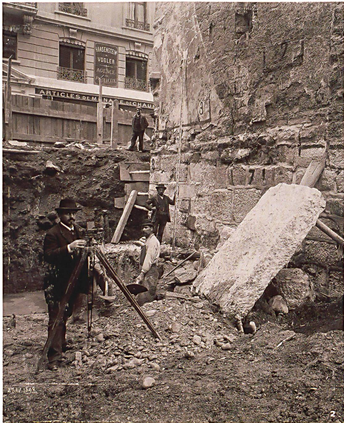
Fig. 2 Vue des fondations de la Tour de l'Île, dégagées en 1898.

Ansicht des Fundaments der Tour de l'Île, freigelegt im Jahre 1898.