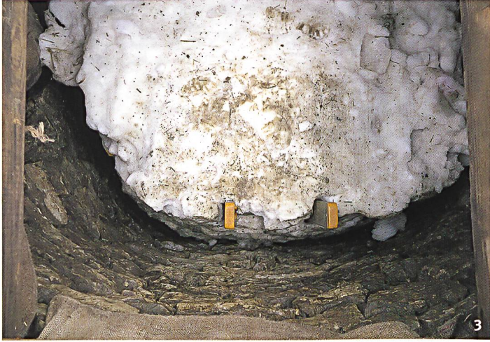
Abb. 3 Blick in den mit Schnee und Stangeneis verfüllten Schacht während des zweiten Versuchs (Zustand Mitte April 2017).