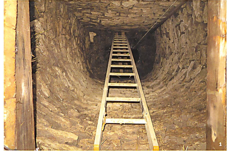
Abb. 1 Blick in den ca. 4.2 m tiefen, trocken gemauerten Schacht (Zustand im Januar 2017).

Ausgangspunkt für eine Interpretation von Schacht «MR 6/MR 32» als fossa nivalis bildet die Tatsache, dass Schnee und Eis in antiken Schriftquellen erstaunlich oft erwähnt werden, vorab im Zusam-