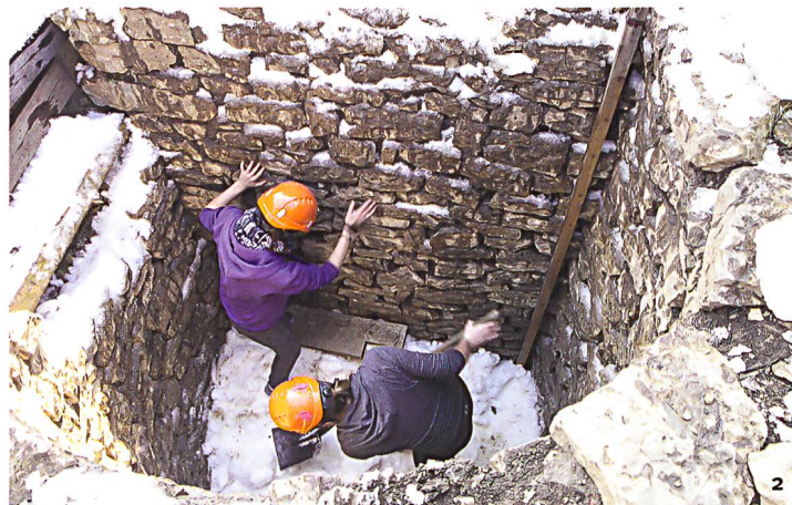
Abb. 2 Festtreten des eingefüllten Schnees während des ersten Versuchs im März 2016.

Besser funktionierte beim zweiten Versuch die Erfassung der thermohygraphische Messwerte mit Hilfe von Datenloggern. Im unteren Teil des Schachts bewegte sich die Temperatur während des Schmelzens des Schnees zwischen Januar und