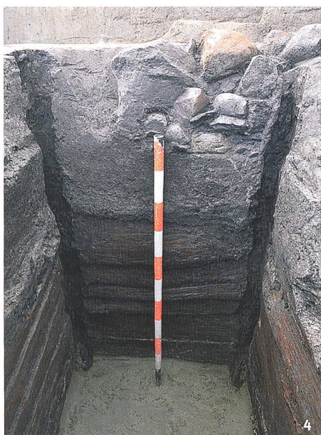
Fig. 4 L'un des deux puits, avec son cuvelage composé de planches de bois, découvert à la zone sportive.

Einer der beiden auf dem Sportplatz freigelegten Brunnenschächte, hier mit einem Schachtausbau aus Holzplanken.