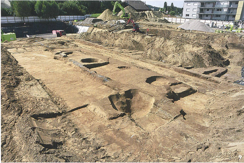
Fig. 9 Vue générale des fosses-dépôts une fois vidées de l'aire cultuelle de Sous-Ville.

Blick über die bereits ausgegraben benen Deponierungs-Gruben im kultischen Bereich von Sous-Ville.