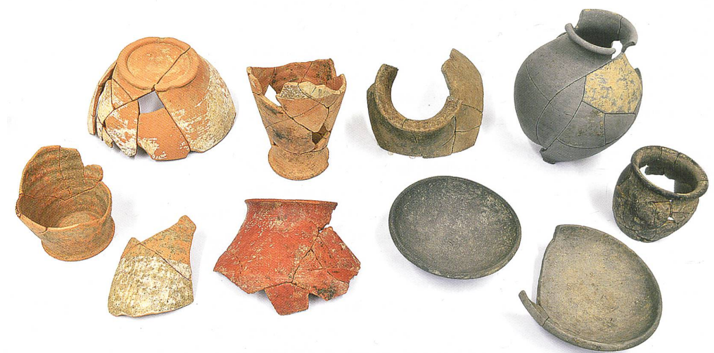
Fig. 7 Céramiques issues d'une fosse du site de Sur Fourches.

La petite fosse mise au jour en 2003 à Sur Fourches, qui contenait huit passe-guides en alliage cuivreux datés de La Tène D1 (150-80 av. J.-C.), n'est plus un cas isolé. Dans ce même secteur ont en effet été fouillées, entre 2016 et 2017, plusieurs autres fosses-dépôts, à l'exemple d'une petite structure circulaire caractérisée par un ensemble de céramiques peintes et à pâte grise, complètes ou presque, ou représentées par de grandes portions manifestement sélectionnées.