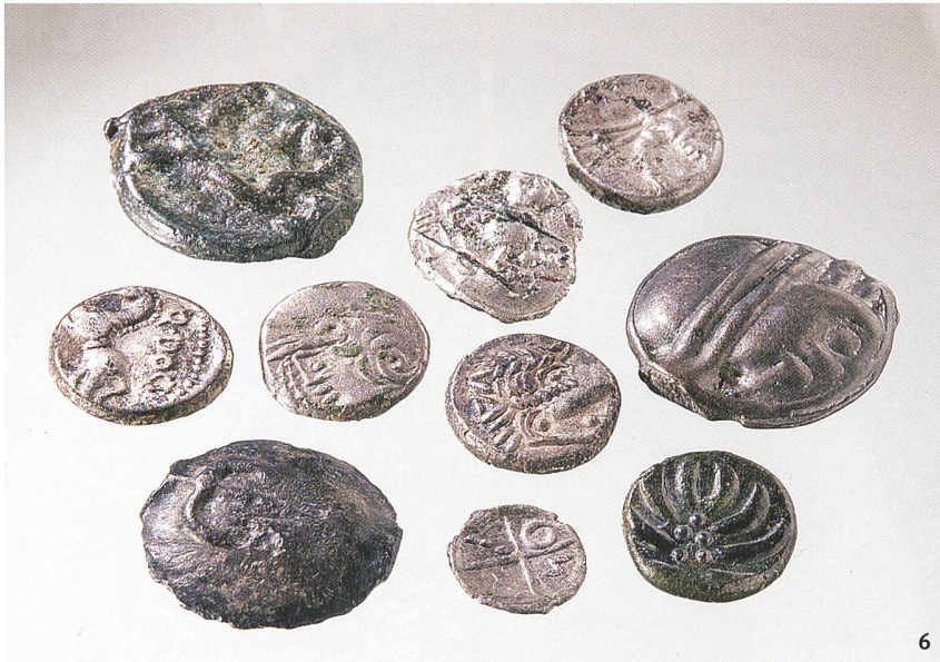
Fig. 6 Près de 60 monnaies celtiques proviennent de la région de Sous-Ville.

Aus dem Gebiet Sous-Ville sind fast 60 keltische Münzen bekannt.