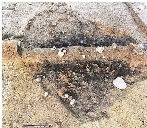
Fig. 3 Ce cellier mis au jour à Sur Fourches a livré de nombreuses céramiques de stockage.

bâtiments. Toutefois, les récentes investigations ont conduit à la découverte d'un nombre important de fosses, fossés, trous de poteaux, empièvements et tronçons de sablières basses, qui témoignent d'un habitat dense et étendu. Par ailleurs, malgré un arasement important des vestiges qui a induit la disparition de la plupart des sols, des foyers et des restes de parois, des zones construites peuvent être repérées grâce au regroupement de plusieurs aménagements caractéristiques, par exemple des fosses-dépotoirs, ainsi que plusieurs structures de stockage (fosses-silos ou fosses-celliers). Excavées dans le sous-sol des habitations, ces dernières ont en effet moins été affectées par les phénomènes d'érosion et restent donc identifiables, non seulement par leur plan rectangulaire de grandes dimensions, leur fond plat et leurs parois verticales, mais aussi par le type de mobilier qu'elles contiennent. Le cellier de Sur Fourches (3,20 x 2,30 m) en est une bonne illustration. Grâce à la concentration de crampons en fer retrouvés dans son comblement, on peut imaginer que ses parois étaient revêtues de planches, ou qu'il disposait d'une couverture en bois. Entre autres biens, on y entreposait des denrées contenues dans de grands vases de stockage (jarres et bouteilles) datés de La Tène D1 (150-80 av. J.-C.), dont plus d'un millier de fragments tapissaient le fond de la structure.