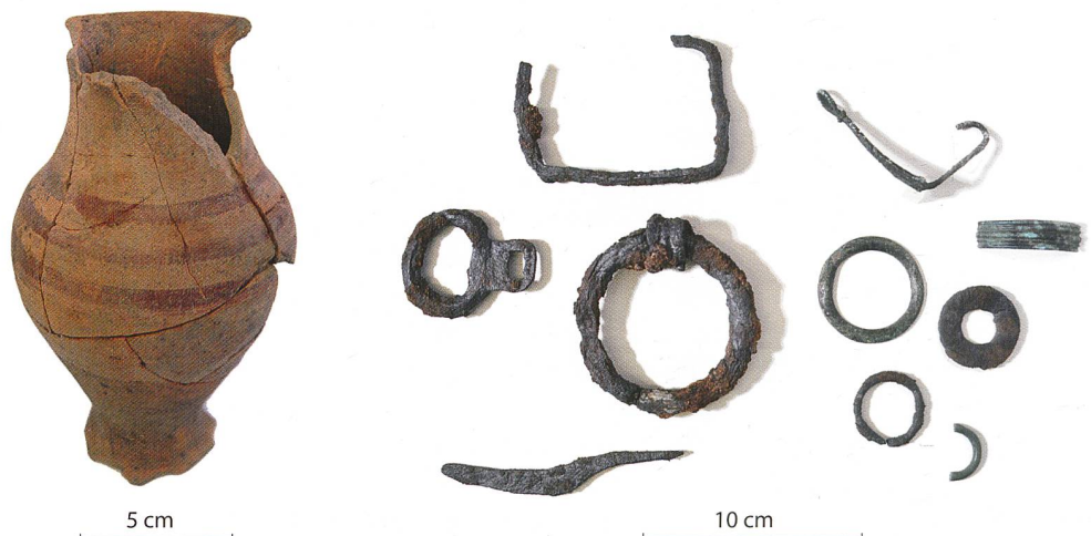
Fig. 10 Assemblage de mobilier céramique et métallique déposé dans une fosse de Sous-Ville.

Même si les limites et l'étendue de cette occupation gauloise restent encore approximatives, elle paraît se développer sans hiatus depuis le milieu du 2 e siècle av. J.-C. jusqu'à la création de la ville romaine, peu avant le tournant de notre ère, tout en se déplaçant au fil du temps d'ouest en est. La région occidentale concentre effectivement les vestiges remontant à La Tène D1 et D2a (150-50 av. J.-C.), tandis que la zone du Faubourg, où la