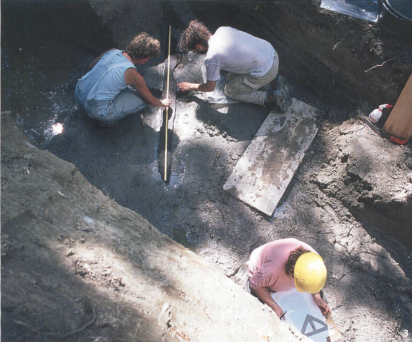
Abb. 3 Die Ausgrabung in La Tène im August 2003: Freilegung eines Holzbretts, das ins Jahr 3824 v.Chr. datiert wurde (Neolithikum).

Scavi di La Tène nell'agosto del 2003: Viene portata alla luce un'asse datata al 3824 a.C. (Neolitico).