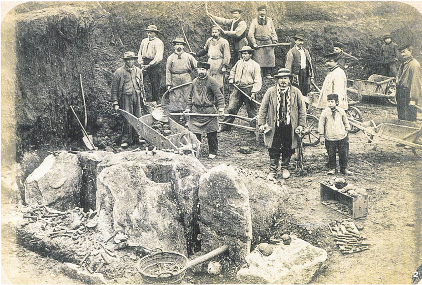
Abb. 2 Der Dolmen wurde während einer Ausgrabung 1876 entdeckt. Dolmen portato alla luce nel 1876 in corso di scavo.

an seinen heutigen Standort im Laténium in Haute-rive. Auf dieser Wandschaft wurde die ursprüngliche Architektur des Grabes durch ungenaue Rekonstruktionen, Beschädigung und das Hinzufügen von modernen Bauteilen nachhaltig verändert.