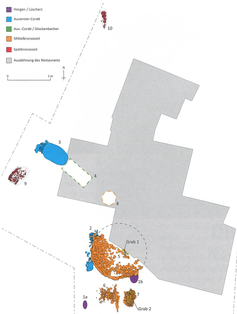
Abb. 5 Übersichtsplan der archäologischen Strukturen nach chronologischen Phasen. 1a-b) Feuerstellen des Spätneolithikums; 2) megalithische Steinreihe; 3) liegender Menhir; 4) Dolmen; 5) Hügelgrab (in der Mitte das Grab 1); 6) Brandgrab; 7) Körperbestattung (Grab 2); 8) Erdbestattung von 1876 (vermutete Lage); 9-10) Feuergruben.

Pianta generale delle strutture archeologiche ordinate per fasi cronologiche. 1a-b) Focolari del Neolitico finale; 2) allineamento megalitico; 3) menhir steso; 4) dolmen; 5) tumulo (tomba 1 al centro); 6) tomba a incinerazione; 7) tomba a inumazione (tomba 2); 8) tomba a inumazione del 1976 (localizzazione presunta); 9-10) fosse-focolari.